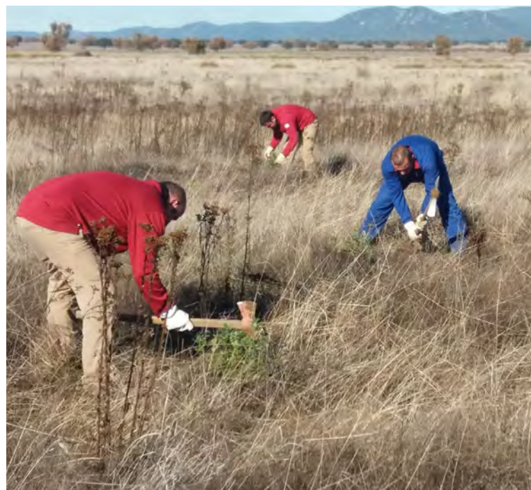
Tratamiento selvícola en el Parque Nacional de Cabañeros (Castilla-La Mancha).

La necesidad de revertir las tendencias negativas de la mayoría de los indicadores de biodiversidad fue el principal impulsor para el desarrollo de este reglamento, al constatarse que los esfuerzos y políticas ambientales de las últimas décadas no están siendo suficientes para conservar la naturaleza de nuestro territorio. Se espera que la Ley de Restauración de la Naturaleza contribuya a recuperar la biodiversidad, mitigar el cambio climático, adaptarse a sus impactos y sostener el suministro de servicios ecosistémicos y el bienestar de las personas.