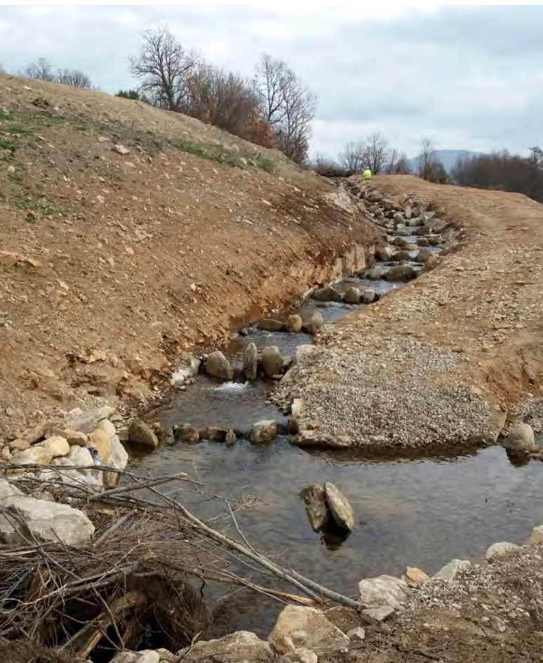
Restauración fluvial en la cuenca del Duero (Castilla y León).

Tras un largo proceso de negociación entre el Parlamento, el Consejo de la UE y la Comisión, durante el cual se flexibilizaron diversos compromisos, la Ley fue aprobada formalmente el 17 de junio por el Consejo de la UE, con 20 votos a favor, 6 en contra y una abstención.