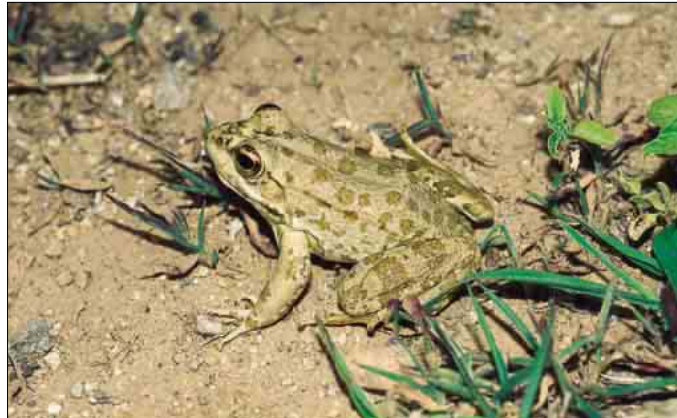
Ejemplar de Marruecos.

Su estatus taxonómico ha estado sujeto a múltiples controversias, aunque recientes estudios morfológicos y genéticos establecen claramente su separación de las poblaciones ibéricas de Rana perezi (BUCKLEY et al. , 1994; LLORENTE et al. , 1996), incluso apuntando a una diferenciación a nivel subespecífico entre las poblaciones argelinas y marroquíes (ARANO et al. , 1998).