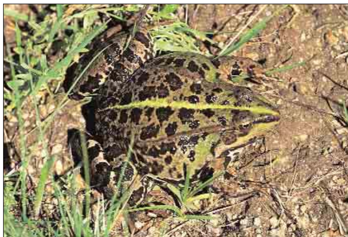
Hembra, ejemplar de Salamanca.

Morfológicamente los ejemplares híbridos son indistinguibles de la especie parental y sólo se detectan en laboratorio mediante técnicas electroforéticas. Así, la distribución y los límites de los diferentes complejos hibridogenéticos de ranas verdes son confusos. Esta situación se observa en R. ridibunda , R. lessonae , con diversas variantes y también en Rana perezi . El complejo hibridogenético de la rana común comprende a R. perezi y al híbrido, que es portador de una dotación genómica de esta especie (que es la parte del genoma excluido en la reproducción), y de una dotación genómica de la especie europea de distribución más norteña R. ridibunda . Los ejemplares hibridogenéticos reciben el nombre de rana de Graf, y el Klepton se ha descrito como Rana Kl. grafi . En el tercio inferior de Francia y en la Península Ibérica pueden encontrarse poblaciones hibridogenéticas. Concretamente en España se han detectado este tipo de poblaciones en el valle del Segre, en la Cerdanya, en los Deltas del Llobregat y del Ebro, así como en localidades costeras del Baix Empordá en Cataluña. Otras poblaciones hibridogenéticas han sido detectadas en Zaragoza