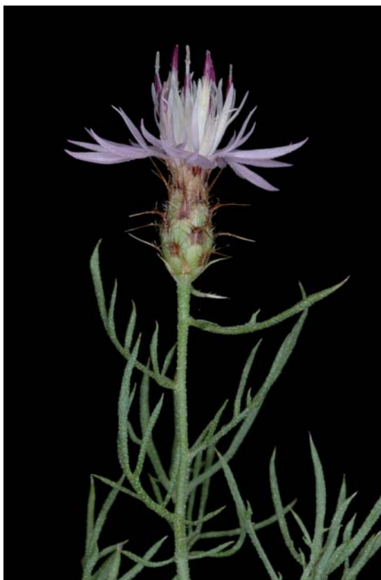
Escobilla de Gádor, centaurea de Gádor