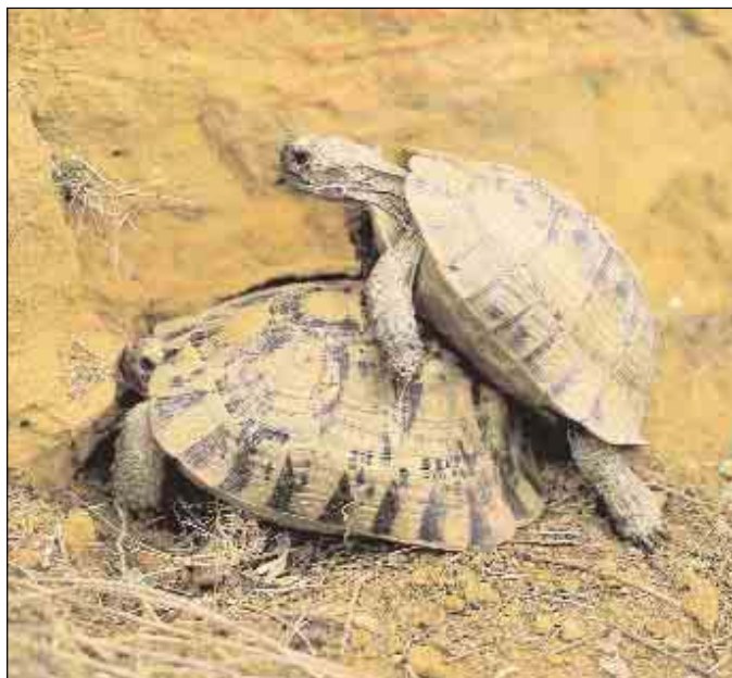
Ejemplares de M'Soura.