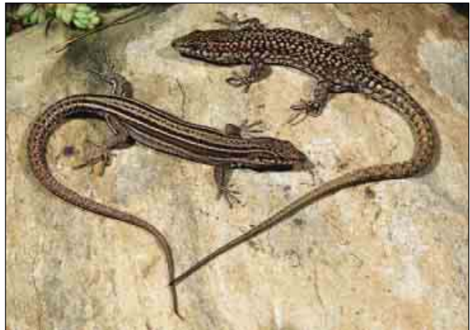
Macho y hembra de Madrid.

Su distribución altitudinal en Iberia abarca desde el nivel del mar hasta 3.481 metros en Sierra Nevada. Ocupa una gran variedad de hábitats naturales y humanizados dónde presenta casi siempre un carácter rupícola, al menos en la mitad septentrional de la Península Ibérica. La situación es, sin embargo, diferente en el este y sur peninsular, donde puede ser la única especie del género Podarcis presente. Entonces, ocupa también el suelo y las formaciones arbustivas, cuando faltan los afloramientos rocosos.