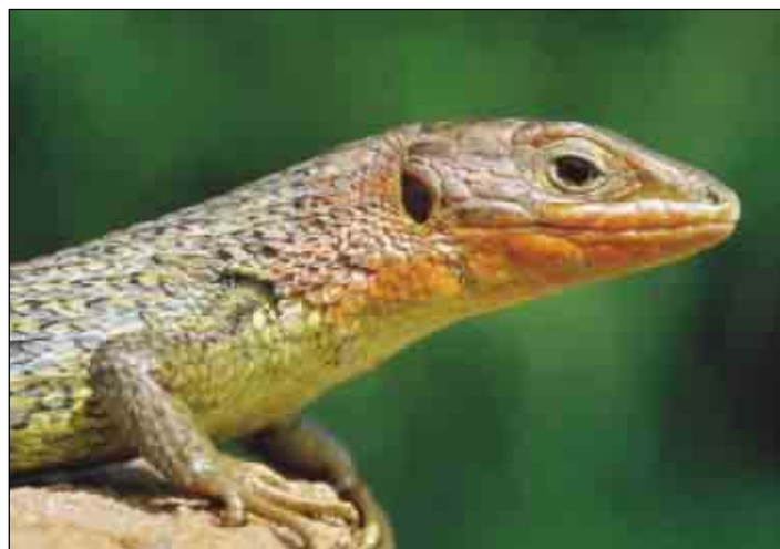
Ejemplar macho de Ferreira do Zezere, (Portugal)

Algunos autores sostienen que su expansión septentrional puede continuar incluso en la actualidad. Por el contrario, se ha constatado la extinción de la abundante pobla-