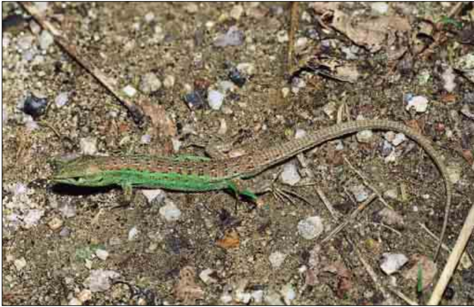
Ejemplar de Cáceres

Sargantaner petit (cat.), espartzudi-sugandila (eusk.), lagartixa cinsenta (gal.)