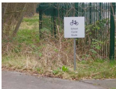
El acceso en bici a la escuela puede hacerse por carretera, con carril-bici no separado... o por una vía ciclista específica.