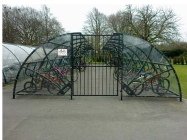
Las sencillas estructuras que guardan las bicicletas proporcionan seguridad antirrobo y protección ante la lluvia.

Llegar a alumnos de Secundaria requiere una forma diferente de trabajo, y en este caso, la visita a esta escuela tenía como objetivo publicitar un futuro curso de bicicleta de montaña. Para difundir personalmente la información del curso y animar a los alumnos a inscribirse, Sustrans organizó, durante la hora del almuerzo, una exhibición de pericia ciclista (o, según se mire, acrobacias sobre la bicicleta) a cargo de un monitor especializado... ¡todo vale!