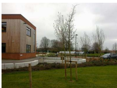
Vista del entorno de la escuela con algunos de los aparcamientos cubiertos para las bicicletas (al fondo).