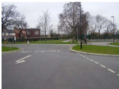
Entrada a la escuela con circulación segregada.