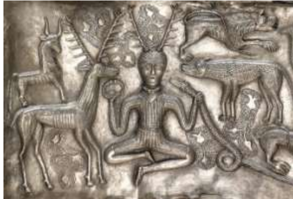
Cernunnos. Fragmento del caldero de Gundestrup