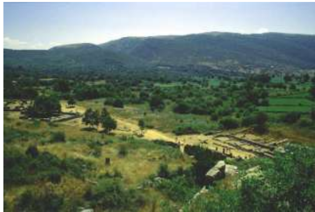
Restos del santuario de Zeus en Dodona, donde su oráculo se interpretaba a partir del sonido que el viento ejercía sobre unas cadenas y calderos colgados de las ramas de un roble, el árbol de Zeus.

En el Lazio, antes del dominio romano, los gemelos Rómulo y Remo poseían las cualidades de los nacidos bajo el árbol consorte. En las distintas versiones del mito los gemelos escapan al ahogamiento en las aguas y son amamantados por una loba hasta que un servidor del monarca los recoge y los educa. Una higuera los protege y abriga mientras la loba los alimenta. Cuando Plinio el Viejo escribe su Historia natural habla de este árbol que crece en el foro y de la loba de bronce que los romanos veneran bajo sus ramas. El comportamiento del árbol es tomado como presagio y cuando se seca los sacerdotes se apresuran a plantar uno nuevo ya que el árbol representaba el destino de la ciudad. Para Corvol esta historia es un eco del culto rendido a la Madre local, que tenía como auxiliares a la higuera y a la loba y que, en ese lugar, engendró a los hombres en un enclave que permanecería poblado tanto tiempo como viviese el árbol. Algo muy parecido le ocurre a Moisés, abandonado en las aguas del Nilo hasta que un obstáculo, un árbol o una roca, retuvo su canasto en la orilla. El árbol estaba ligado al ciclo de las estaciones y su propia vida cíclica era una alegoría del poder o la potencia vital. Unido a otros elementos que pueden llegar a ser contrarios, como por ejemplo las rocas, puede representar la universalidad del cosmos: