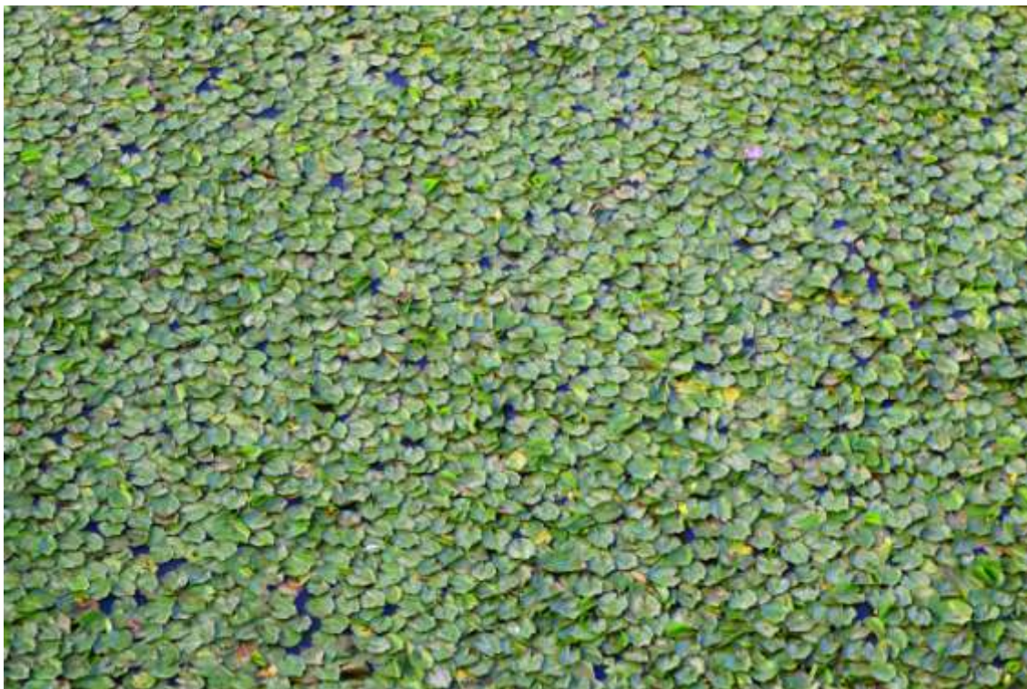
El camalote es un gran problema ambiental en ríos como el Guadiana a su paso por Mérida, Badajoz, Extremadura. La fotografía es una herramienta con enormes posibilidades para ilustrar las tensiones y problemas ambientales de nuestros espacios naturales.

De manera particular se ha empezado a avanzar en la definición del papel de la fotografía en los grandes retos de los espacios protegidos, en concreto en su comunicación desde foros como EUROPARC-España. Se ha abierto el debate sobre el papel estratégico de la fotografía en la comunicación de las áreas protegidas, en trasladar a la sociedad los principales mensajes, especialmente pensando en el público general más o menos alejado de la problemática de estos espacios. De diferente manera una vez descendemos a escala de espacio natural protegido concreto puede destacarse, en primer lugar, el papel de la fotografía en la divulgación de sus valores patrimoniales, y, como la otra cara de la moneda, la capacidad de la fotografía para ilustrar problemas, tensiones y amenazas. La fotografía puede tener también un papel en la difusión de la gestión activa de muchos espacios, de los beneficios sociales derivados de su conservación –la aportación de la naturaleza al bienestar humano- o de las implicaciones normativas y regulaciones derivadas, en su caso.