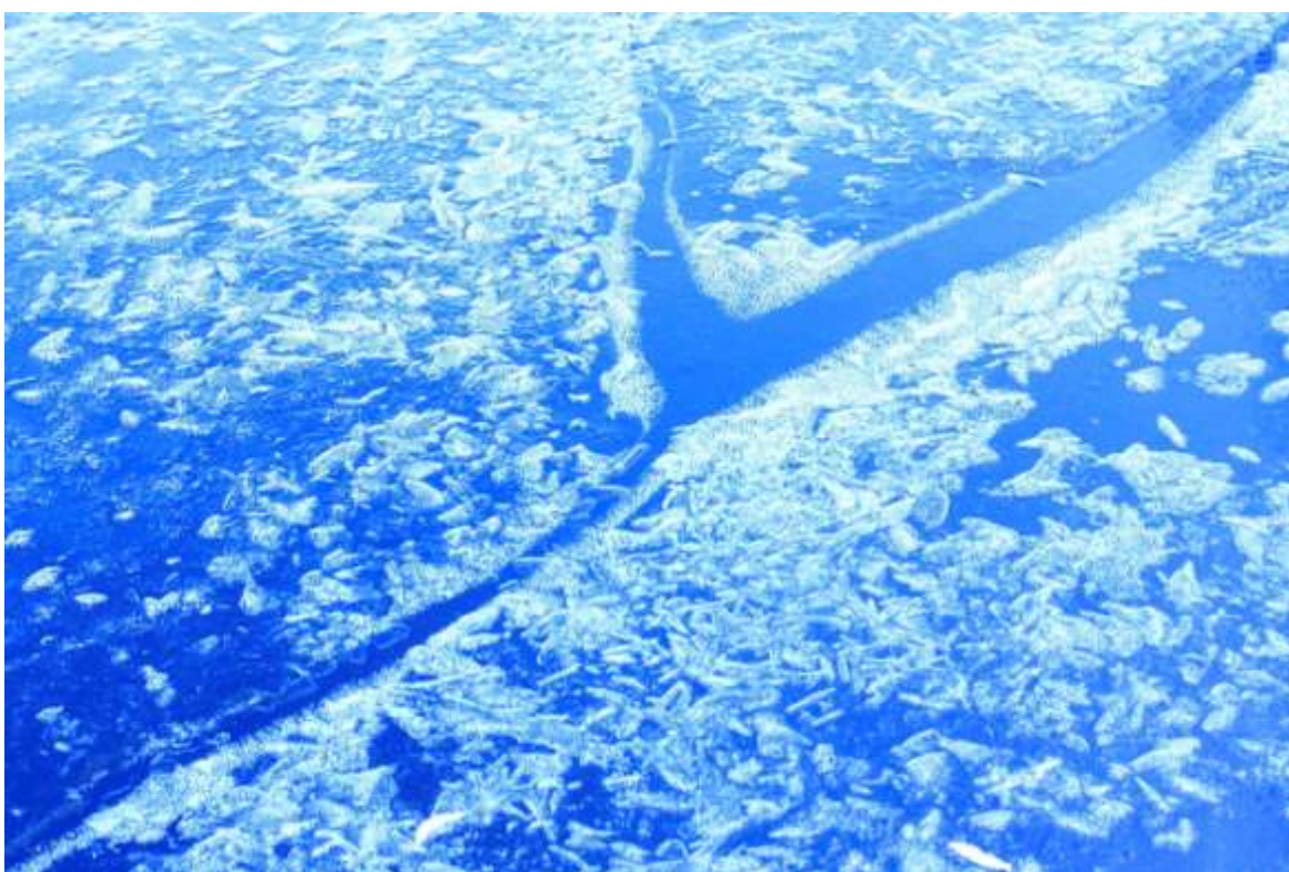
Gélidos detalles invernales.

FOTOGRAFÍA DE APROXIMACIÓN, DETALLES NATURALES, VISIONES INUSUALES