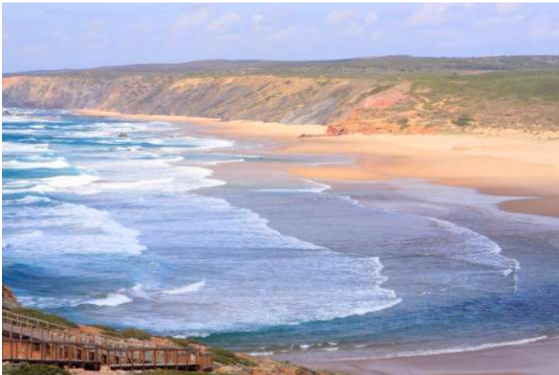
Grandiosos paisajes del Parque Natural del Algarve, Portugal. Muchos de nuestros grandes paisajes invitan a adentrarnos en la naturaleza, e incitan la práctica fotográfica.

La fotografía nos permite un especial acercamiento a la naturaleza, una especial manera de descubrir y disfrutar las mil y una caras de nuestros espacios naturales y territorios rurales. Bajo esta premisa se plantea una reflexión abierta sobre el auge de la fotografía en los espacios naturales, sobre las sinergias entre el arte fotográfico y la naturaleza, sobre el papel de la fotografía en la conservación... Y sobre cómo estos planteamientos cristalizan de algún modo en mis Naturalezas Fotográficas , iniciativa en la que se alinean visión geográfica, dedicación profesional a los espacios naturales protegidos y pasión fotográfica.