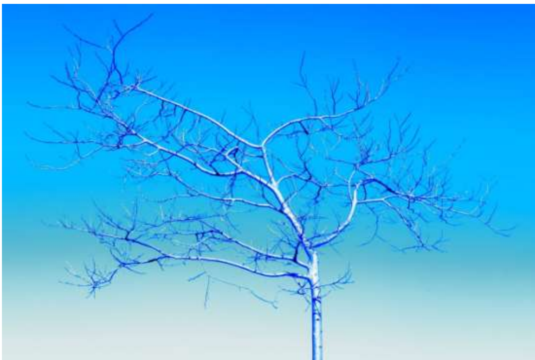
Nogales metalizados, árboles fantásticos.