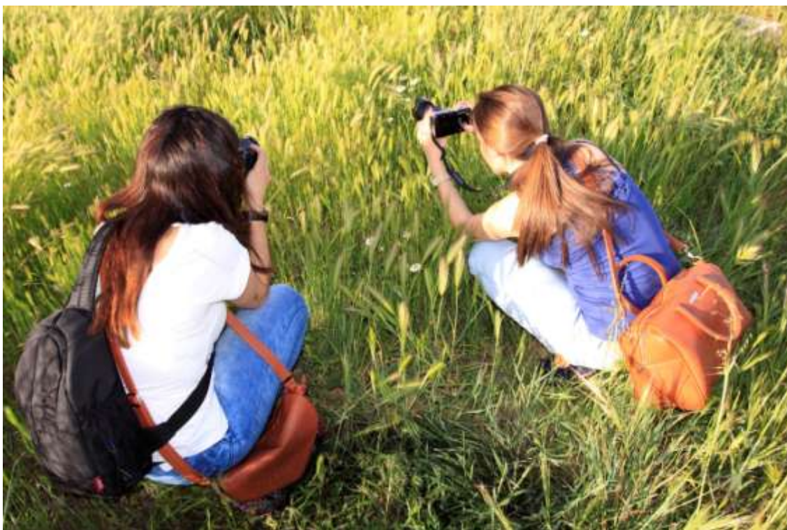
Actividad fotográfica en el Parque Forestal de Polvoranca, Comunidad de Madrid. La naturaleza más accesible, explorando lo pequeño y cercano, puede llegar a ser realmente motivadoras para muchos aficionados a la fotografía.

Ya se trate de fotógrafos generalistas que disfruten de su afición también en nuestros espacios naturales, ya se trate de fotógrafos de naturaleza más o menos especializados, muchas veces son tantos y tan motivadores los retos fotográficos que ofrece la naturaleza más inaccesible en los parques nacionales que en otros enclaves naturales urbanos y metropolitanos, estos últimos mucho más accesibles y no tan frágiles. Debemos superar la idea, seguramente más extendida de los que creemos, de que las grandes fotografías de paisajes sólo pueden abordarse en parques nacionales, y, por otro lado, que seguramente especies comunes y accesibles nos van a dar mucho más juego fotográfico que especies muy “cotizadas” como el lince o el águila imperial.