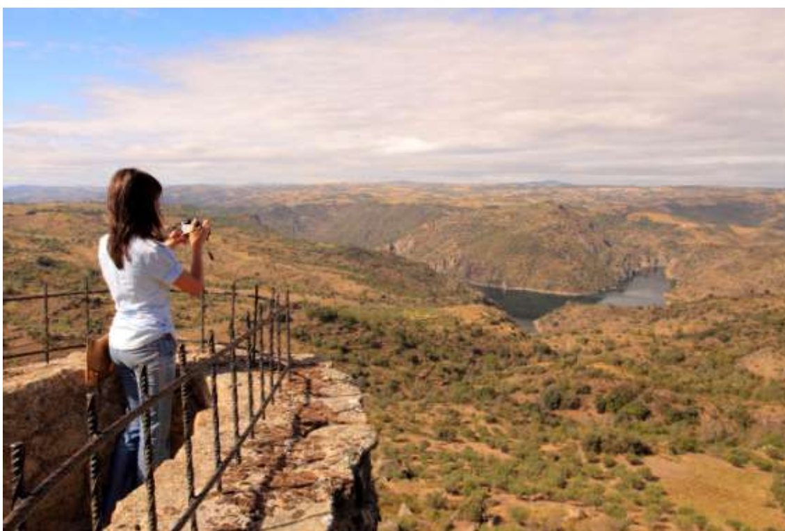
Amplia panorámica del Parque Natural de los Arribes del Duero, Zamora, Castilla y León. La fotografía de paisaje, centrada en nuestros espacios naturales y territorios rurales, es una de las disciplinas más universales.

La práctica de la fotografía en la actualidad puede estar, pues, entre los principales motivos de la visita a nuestros espacios naturales, y se perfila como una de las actividades más demandadas. Y es que la fotografía de naturaleza en sus distintas modalidades encuentra en los espacios naturales una de sus predilectas áreas de campeo. Resulta lógico. Nuestros espacios naturales, parques y otras áreas protegidas son lugares donde es sencillo encontrar estimulantes paisajes, atractivas geomorfologías y poblaciones de especies que, en ocasiones, sólo es fácil encontrar en estos lugares. En realidad, son cuasi infinitas las posibilidades fotográficas que ofrecen los espacios naturales, desde las más modestas zonas verdes urbanas a los parques nacionales. Dicho en otros términos, y este es un pilar de la reflexión que inmediatamente se aborda, los espacios naturales son fuente de inspiración artística poco menos que insustituibles para los fotógrafos interesados.