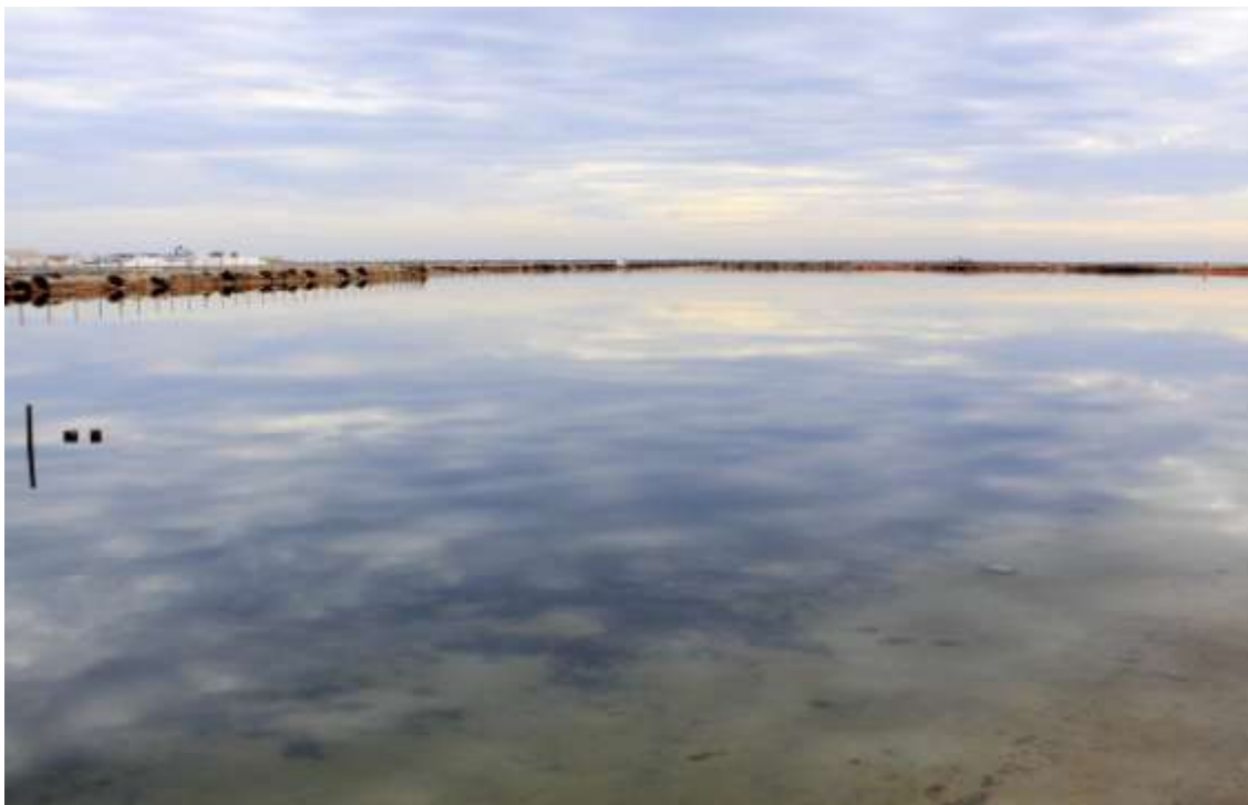
Paisajes naturales, paisajes culturales. Y viceversa.