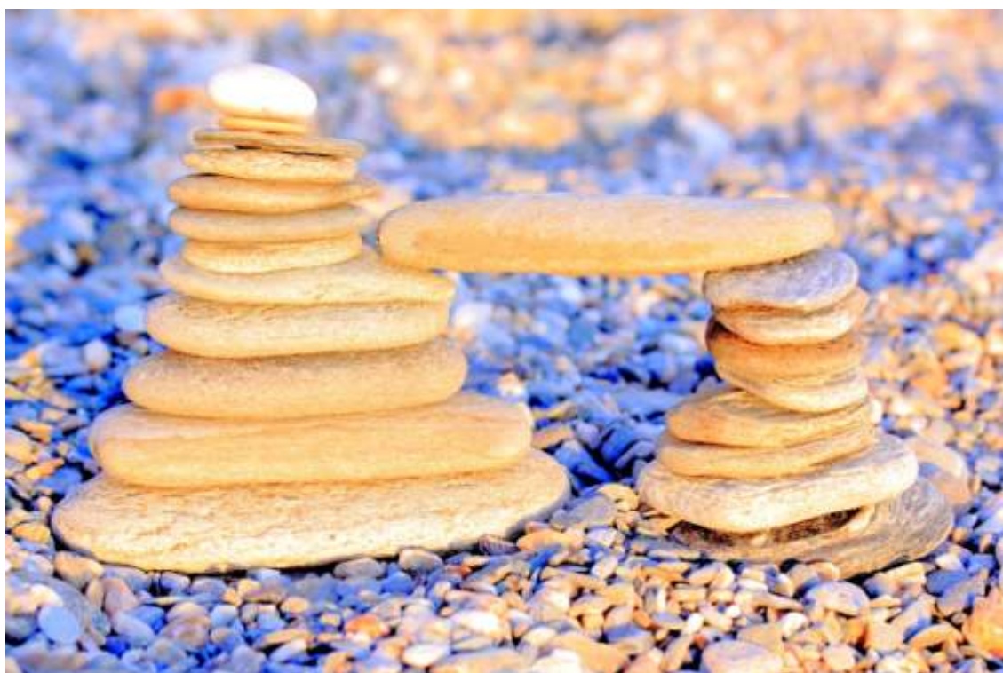
Photolandart, a todo color.