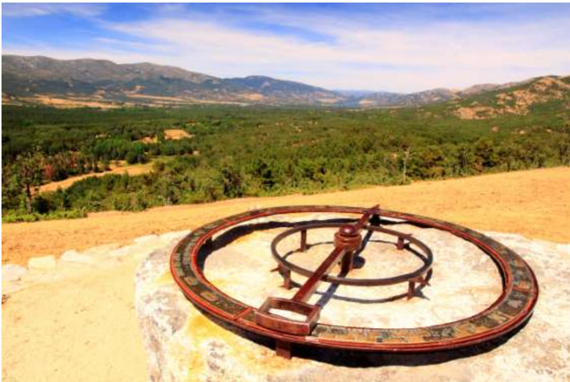
Paisajes forestales de la ZEPA del Alto Lozoya, Comunidad de Madrid. Escudriñar cámara en mano los paisajes integrando lo natural y lo cultural puede llegar a enriquecer estéticamente nuestras instantáneas, y ampliar sus significados.

Entre las principales virtudes de la fotografía para conectar con la naturaleza el arte fotográfico exige sosegar, detenerse, parar, y, simultáneamente, mirar, explorar con la mirada, dar cancha a la contemplación y al deleite visual, escudriñar los paisajes a la búsqueda de detalles sobresalientes, disfrutar de la escena -o no- que tenemos delante. Después, sólo después de disfrutar una vivencia fotográfica completa, culminaremos nuestra mejor instantánea. Sólo si se procede de esta manera obtendremos imágenes notables, estética y artísticamente reconocidas—empezando por nosotros mismos—, fotografías que realmente funcionan facilitando un locuaz diálogo con quien las tiene delante. Es este un valor añadido que la fotografía comparte con otras muchas otras disciplinas artísticas, desde la pintura a la literatura pasando por la música, cuando la fuente de inspiración es la naturaleza.