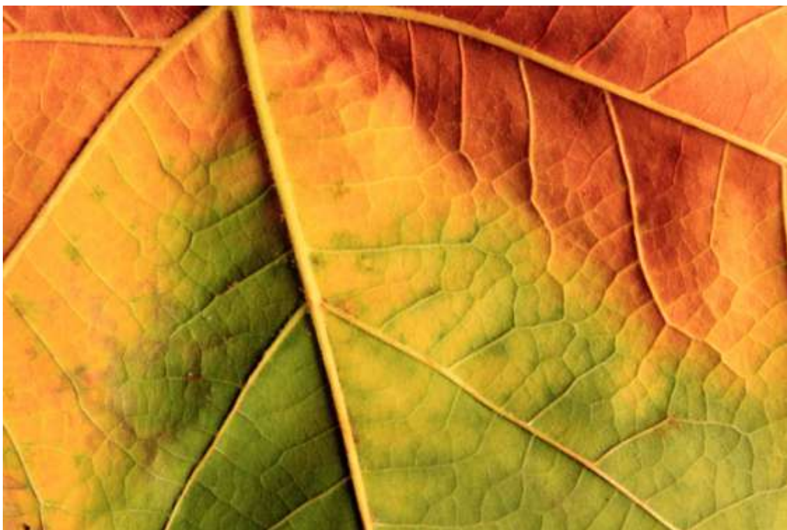
Detalle otoñal de plátano falso en el entorno del Parque de Solidaridad de Fuenlabrada, Comunidad de Madrid. La fotografía de aproximación nos revela detalles vegetales del máximo interés, tanto estéticamente como desde el punto de vista didáctico de las ciencias naturales y sociales.

Poniendo nuevamente la atención en los espacios naturales, retomemos la idea de que es preciso un conocimiento adecuado de los lugares y elementos de la naturaleza sobre los que pretendamos centrar nuestro ejercicio fotográfico. En primer lugar existen argumentos relacionados con la ética ambiental, en el sentido que deberíamos procurar reducir al mínimo los impactos. Por otro lado, abordar artísticamente la naturaleza a través de la fotografía nos va a ofrecer una magnífica oportunidad para conocer los elementos y procesos naturales sobre los que sustenta nuestra obra, desde las más documentales a las más abstractas. Y este es un hecho significativo ya que está ampliamente consensuado que las estrategias de conocimiento con base afectiva son más completas y efectivas. La fotografía puede llegar a ofrecer así una posibilidad práctica para aprehender holísticamente la naturaleza, superando las cuestionadas divisiones entre el aprendizaje intelectual y emocional, que bien pueden ir juntos de la mano el uno del otro, y viceversa.