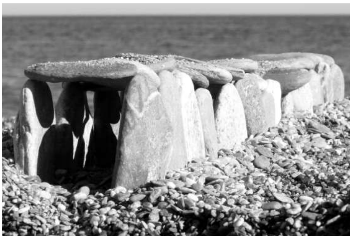
Photolandart, también en blanco y negro.