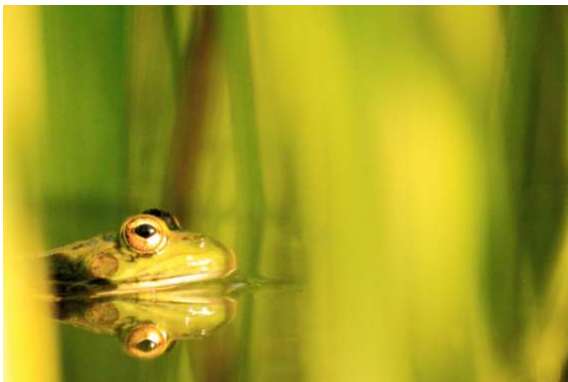
Rana en los jardines del Castillo de Santa Cruz de Olerios, A Coruña. Las especies comunes y frecuentes ofrecen múltiples posibilidades a los fotógrafos interesados.

En el caso de los aficionados y fotógrafos generalistas que asomamos a la fotografía de naturaleza puede ser tan cautivador un roquedo con interesantes texturas y colores que otros elementos mucho más valorados por los fotógrafos de naturaleza. En el caso del colectivo de los fotógrafos de naturaleza a veces el foco se pone exclusivamente en determinadas especies, especialmente atractivas por su singularidad o rareza. Parece interesante, un objetivo alentador, diversificar nuestro archivo explotando los múltiples recursos fotográficos que pueden llegar a ofrecer los espacios naturales y los territorios rurales, jugando con las abstracciones fotográficas, dando cancha a los paisajes panorámicos... Se trata, quizá, de ampliar nuestros objetivos fotográficos más allá de los lugares más demandados y las especies más codiciadas -y otros muchos elementos naturales-, cuyas posibilidades se multiplican sobremanera cuando desplegamos el siempre creciente abanico de técnicas fotográficas.