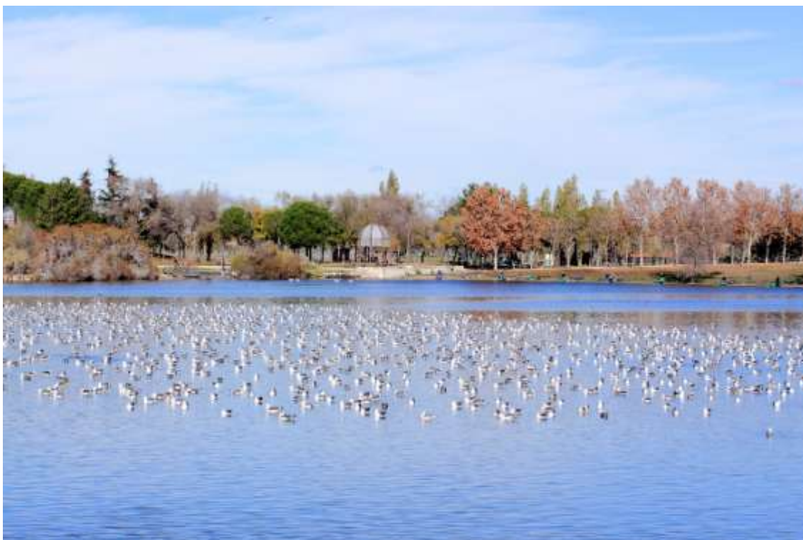
Cuando la fauna conforma paisajes.