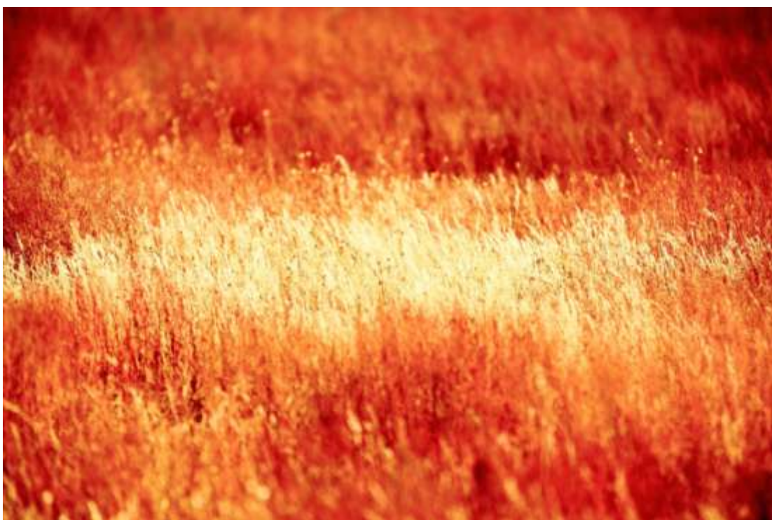
Pastizales, otras visiones.