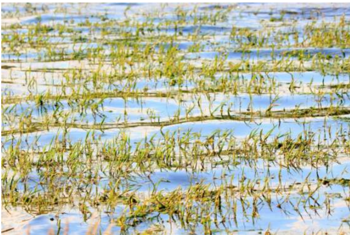
Íntimos rincones vegetales.