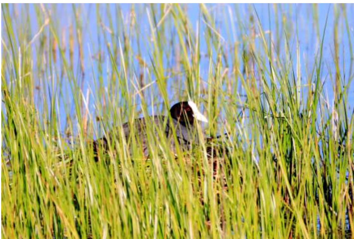
Camuflada, resguardada, recogida. No molestar, y quizá fotografiar.