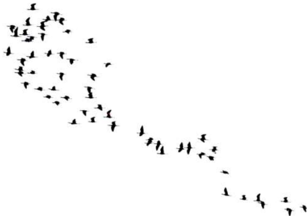
Moritos. 61 siluetas.