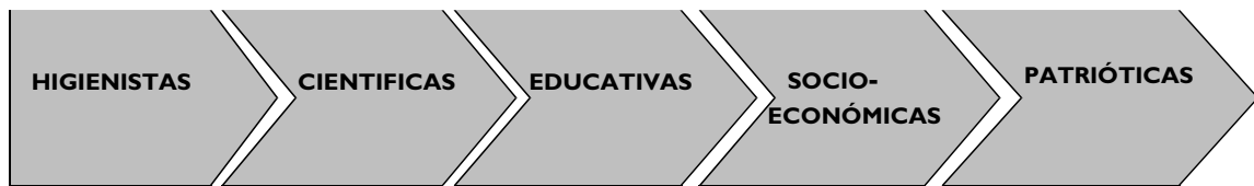
Cuadro nº 2: Tipo de iniciativas atendiendo a los fines

La primera colonia escolar en Galicia fue promovida por la Sociedad Económica de Amigos del País de Santiago, y se desarrolló entre el 31 de julio y el 27 de agosto de 1893 (Antón COSTA, 2001).