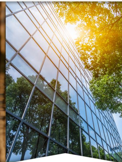
Participación del sector privado en la transición ecológica