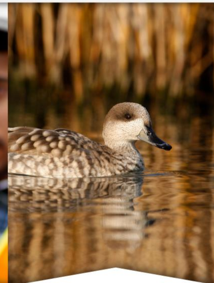
Motores de pérdida de biodiversidad