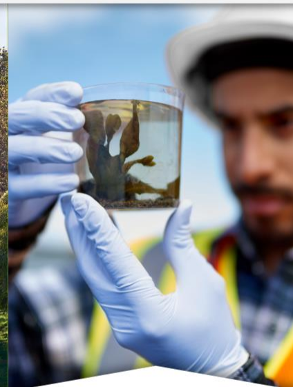
Generación y gestión del conocimiento