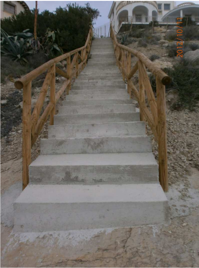
Escalera 2 Fotos del antes: