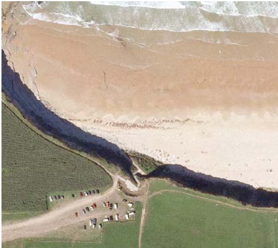
LOCALIZACION DE LA ACTUACION

La escollera de la playa del Tostadero en su tramo inicial se ha movido y se ha retirado el material del trasdos por lo que se rehace el tramo y se rellena el trasdos con material granular mas grueso