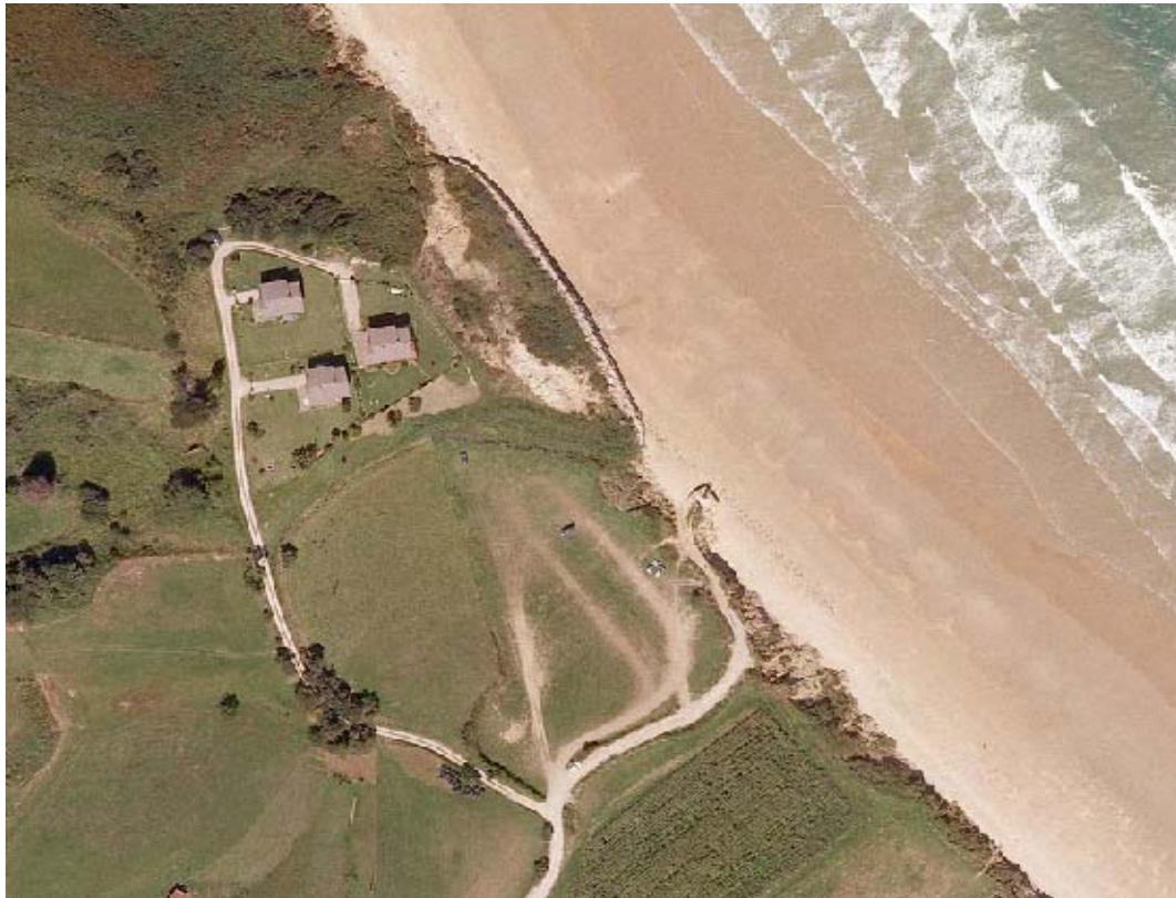
LOCALIZACION DE LA ACTUACION

Las últimas lluvias han provocado el desprendimiento del acantilado por lo que la tarima que da acceso a las escaleras ha quedado parcialmente descolgada