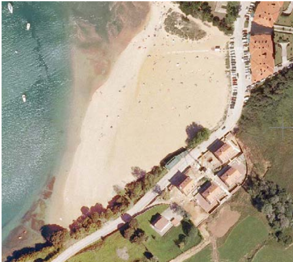
LOCALIZACION DE LA ACTUACION

La escollera de la playa del Tostadero en su tramo inicial se ha movido y se ha retirado el material del trasdos por lo que se rehace el tramo y se rellena el trasdos con material granular mas grueso