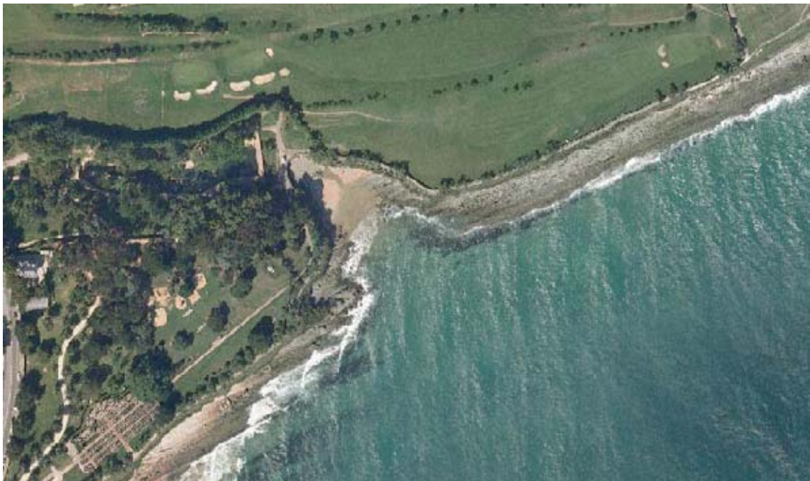
LOCALIZACION DE LA ACTUACION