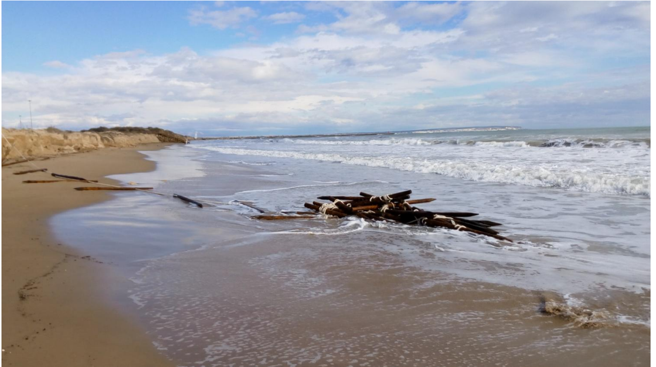
PLAYA VIVEROS. GUARDAMAR DEL SEGURA