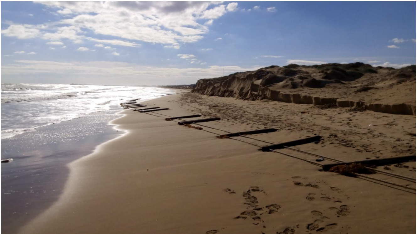
PLAYA LOS TOSALES-REBOLLO. GUARDAMAR DEL SEGURA