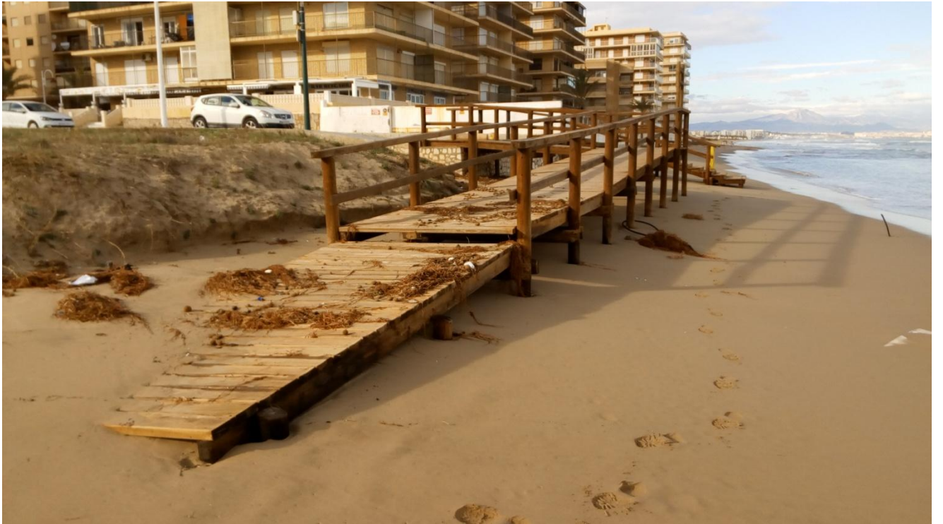
PLAYA ARENALES DEL SOL. ELCHE