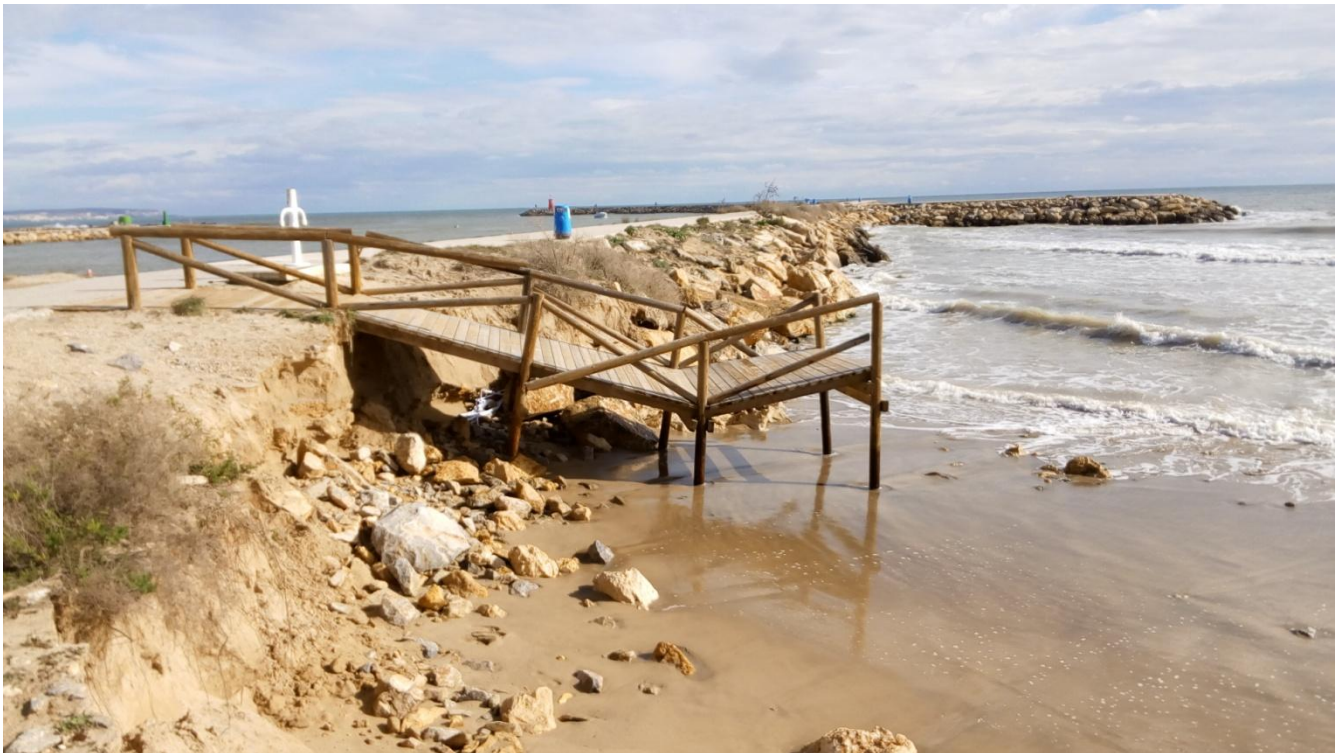
PLAYA VIVEROS. GUARDAMAR DEL SEGURA