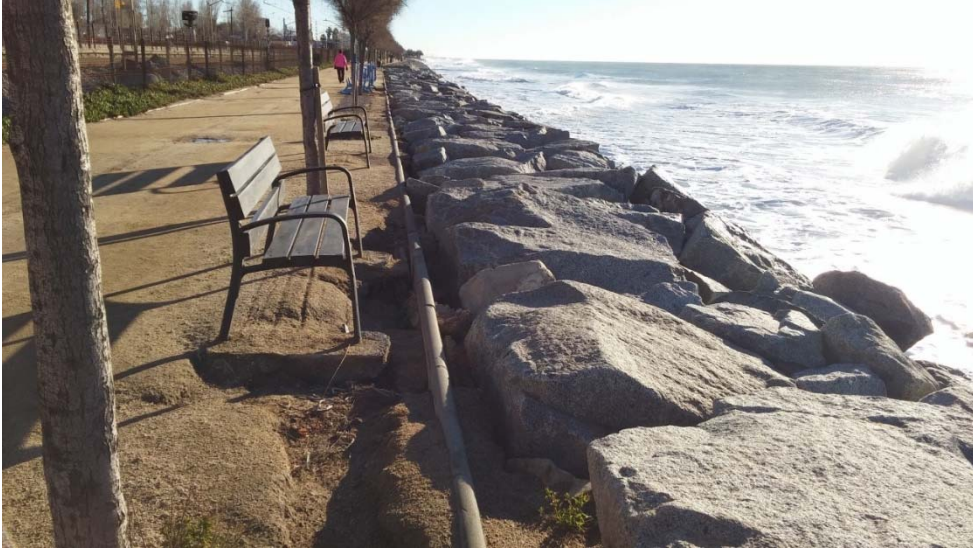
Detalle 3: Premià de Mar