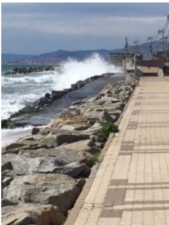
Detalle 5: Ponent i Astillero en Vilassar