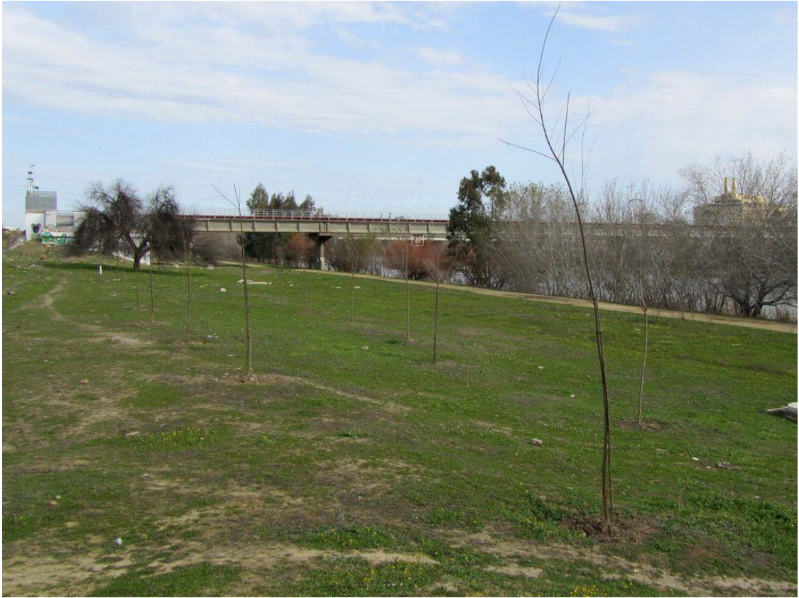
Retirada de residuos