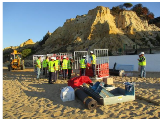
Fotografía 4. Material desplegado y organizado en jaulones