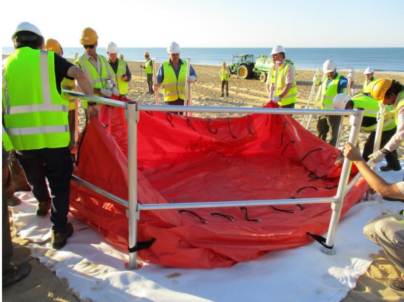
Fotografía 6. Personal interviniente durante el montaje del depósito de estructura