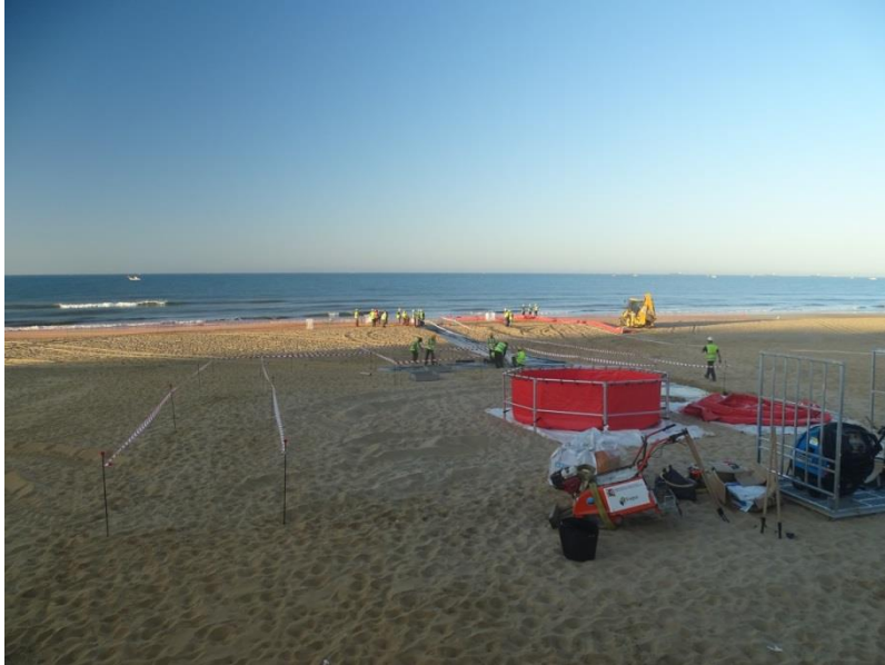
Fotografía 7. Establecimiento de la zona de intervención