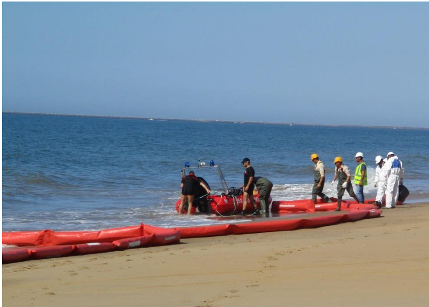
Fotografía 5. Enganche de la barrera selladora a la embarcación del Consorcio Provincial Bomberos Huelva.