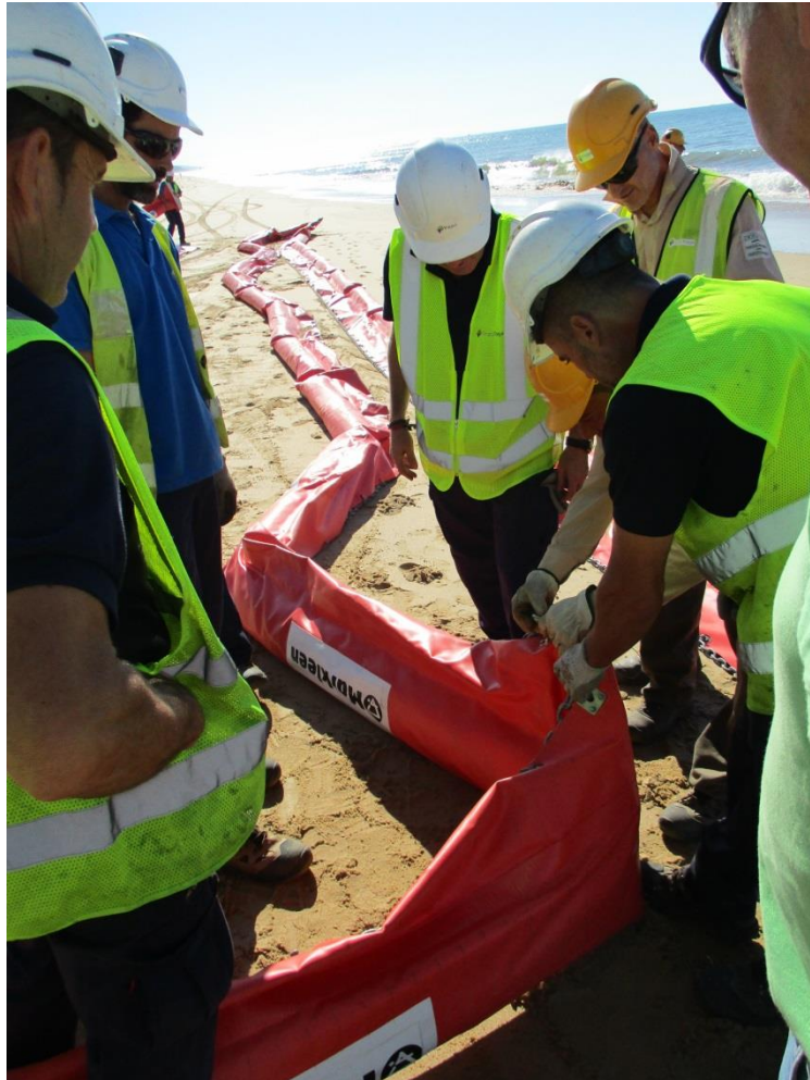
Fotografía 9. Empatado de barrera selladora y cilíndrica rígida