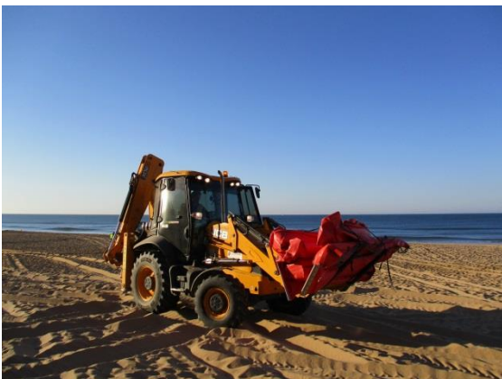
Fotografía 3. Retrocargadora mixta trasladando barrera cilíndrica a la línea de costa