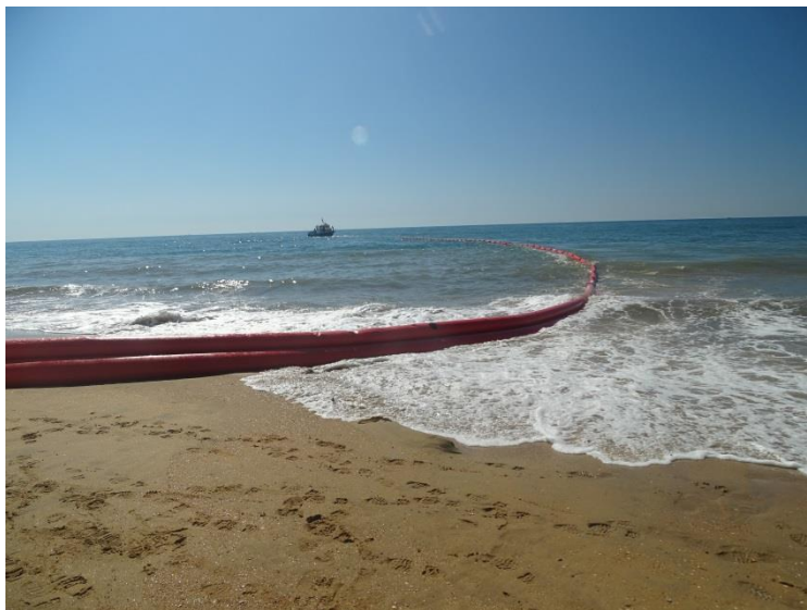
Fotografía 14. Despliegue de barreras