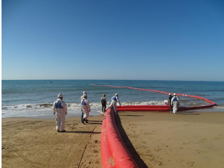
Fotografía 13. Despliegue de barrera por la embarcación de Consorcio Provincial Bomberos Huelva