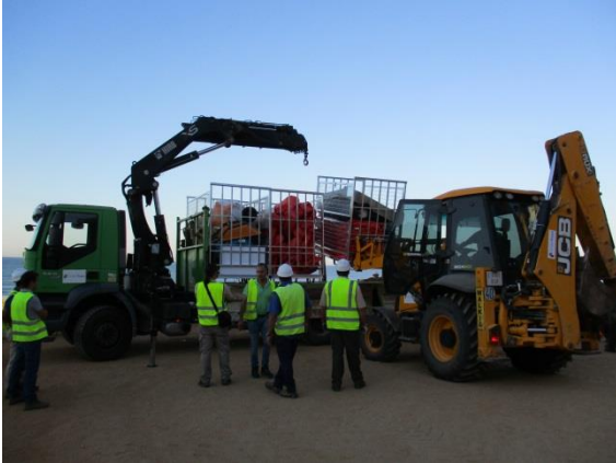
Fotografía 1. Material descargado del camión pluma por la retrocargadora mixta

visibilidad. Además 2 pares de botas vadeadoras han sido empleadas por el personal de enganche de las barreras a la embarcación.