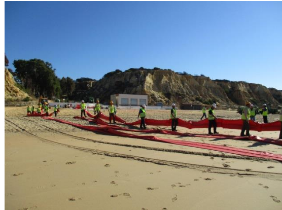
Fotografía 2. Despliegue de barrera selladora