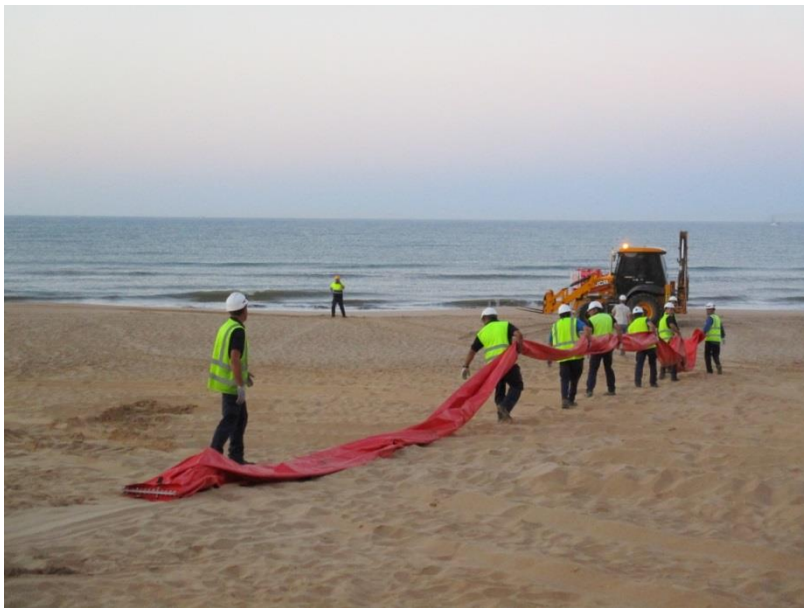
Fotografía 8. Despliegue de barrera selladora

Se ha familiarizado al personal participante con el funcionamiento y disposición de las barreras selladoras.