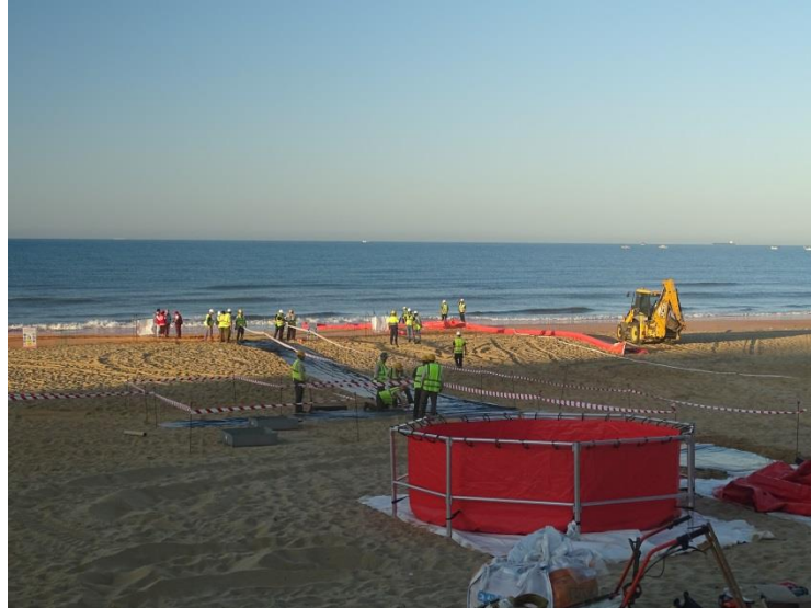
Fotografía 10. Zonificación del área de intervención