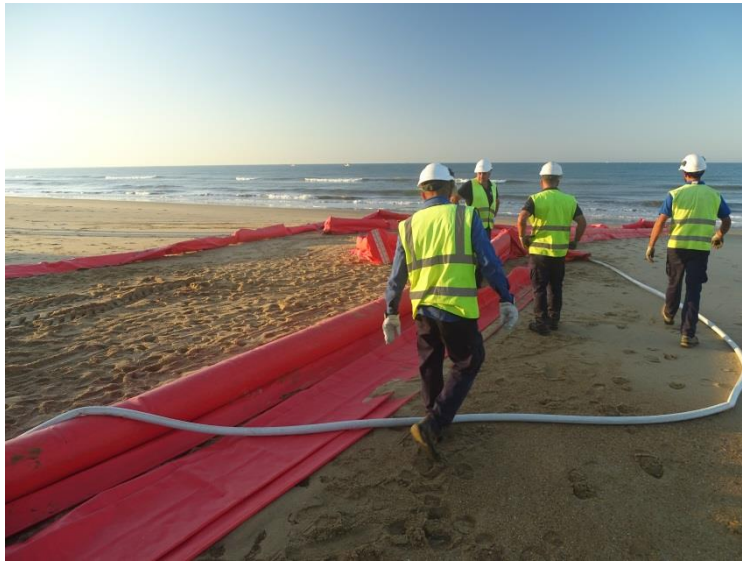
Fotografía 12. Llenado e inflado de barrera selladora