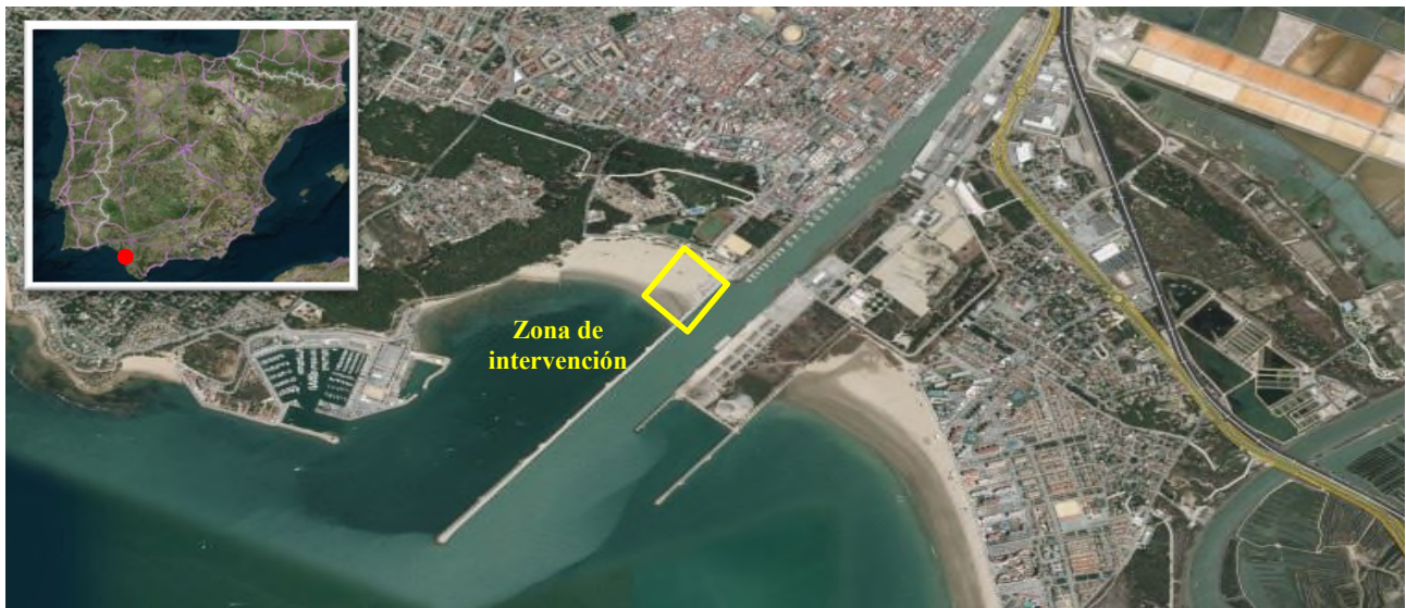
Ilustración 1. Localización de la zona de intervención en la playa La Puntilla (El Puerto de Santa María).

El ejercicio práctico de formación para la lucha contra la contaminación marina se ha llevado a cabo el día 6 de octubre de 2021 en la playa La Puntilla en el término municipal de El Puerto de Santa María, en Cádiz. En concreto, la zona de intervención se localizó en las coordenadas Lat: 36° 35' 2.305" N y Long: 6° 14' 16.633" W, tal y como se muestra en la ilustración 1 (En el Anexo I se adjunta ficha técnica de la playa).