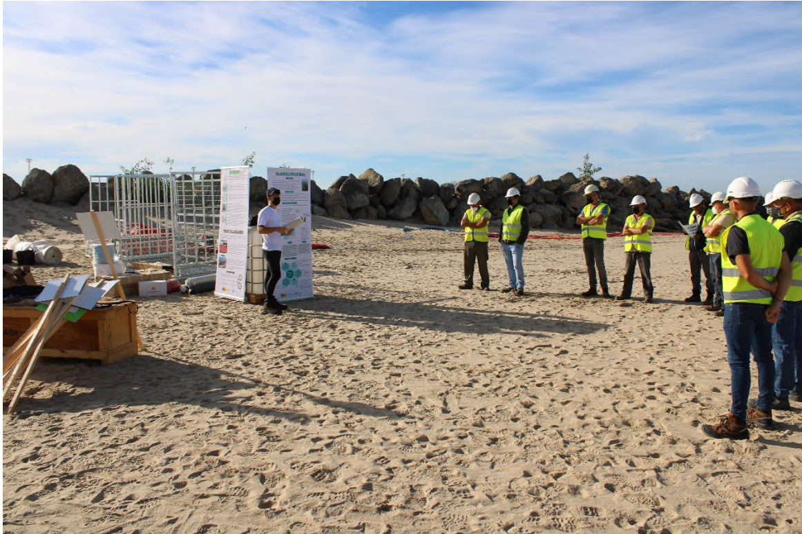
Ilustración 20. Charla formativa sobre la evaluación de la costa contaminada.