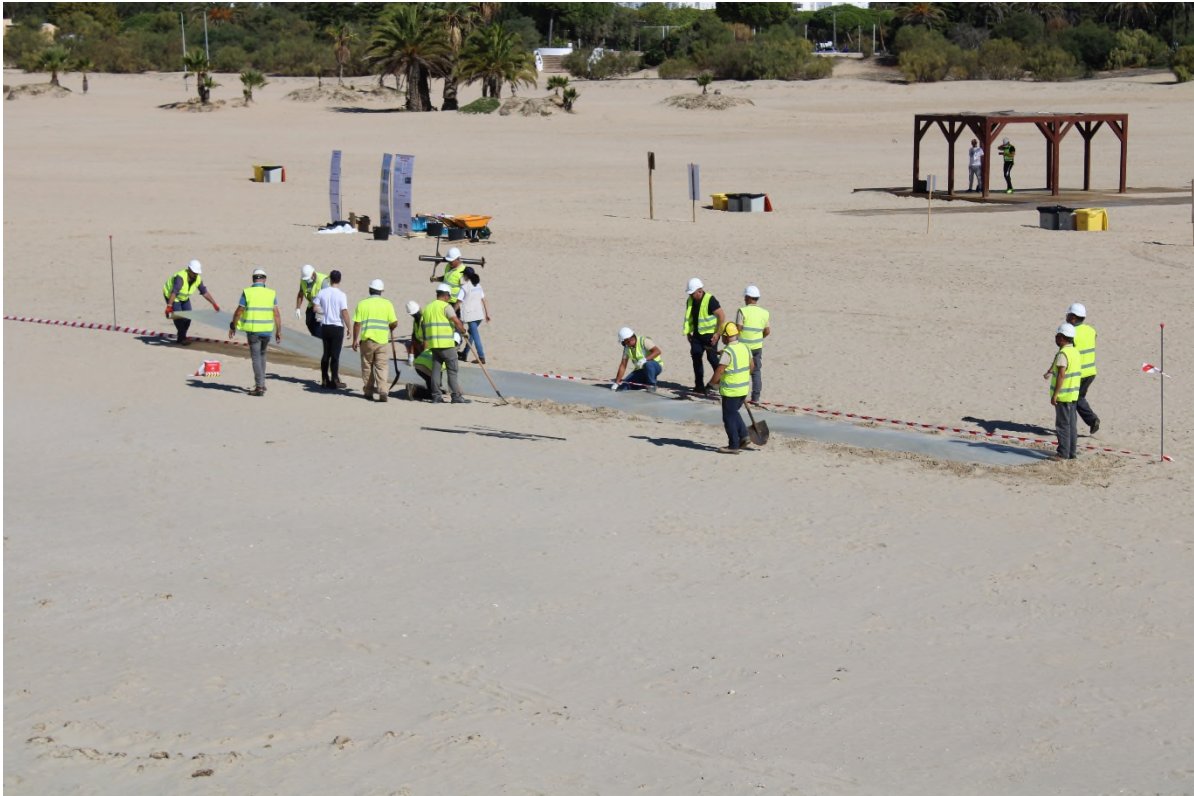
Ilustración 26. Montaje de los corredores con láminas plásticas.

Se ha dispuesto de una zona de exclusión formada por: