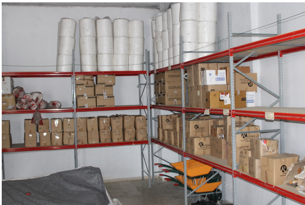
Ilustración 13. Distribución material de LCC en el lateral derecho del almacén (absorbentes y cajas de EPI).