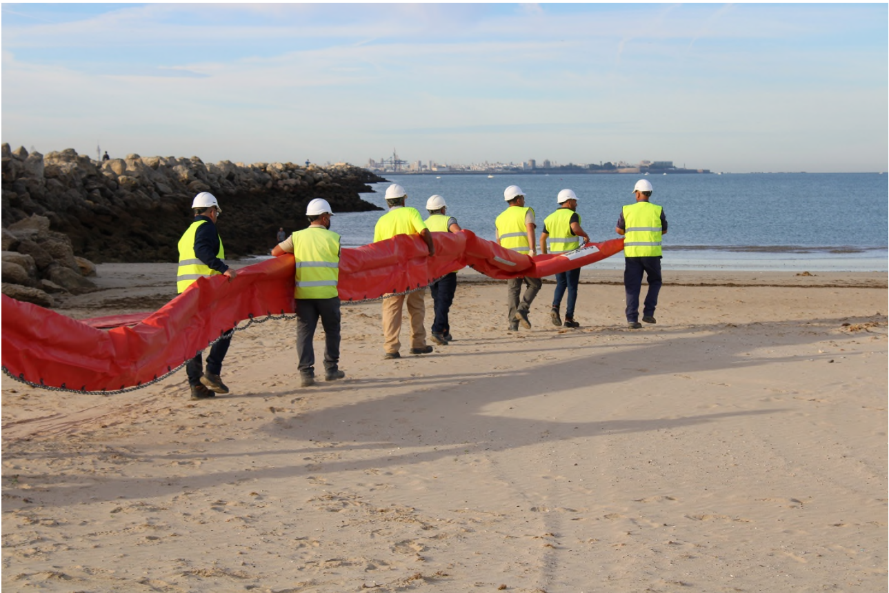
Ilustración 22. Momento en que los intervinientes sacan la barrera cilíndrica para su tendido.

Con las barreras extendidas en la orilla, se lleva a cabo el procedimiento de inflado de la barrera selladora. Para el tendido de esta última se ha empleado una herramienta sopladora para el llenado de la cámara superior y agua dulce para las cámaras inferiores, realizado con el camión cuba desplazado hasta la zona para la componente de lastre.