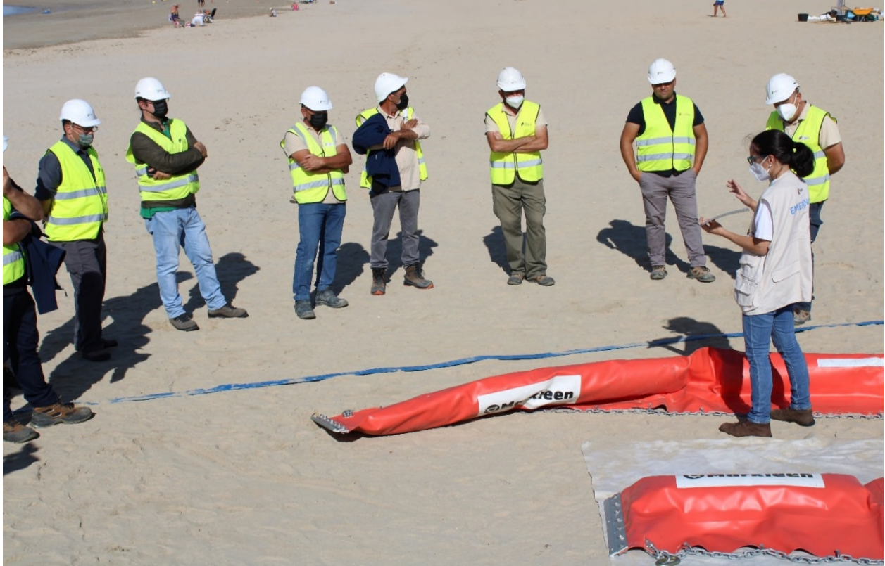
Ilustración 16. Charla formativa de las barreras de contención.