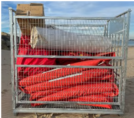
Ilustración 3. Barreras cilíndricas y selladoras en jaulón de almacenamiento

Además, se cuenta con el servicio de un dron para tomas aéreas.