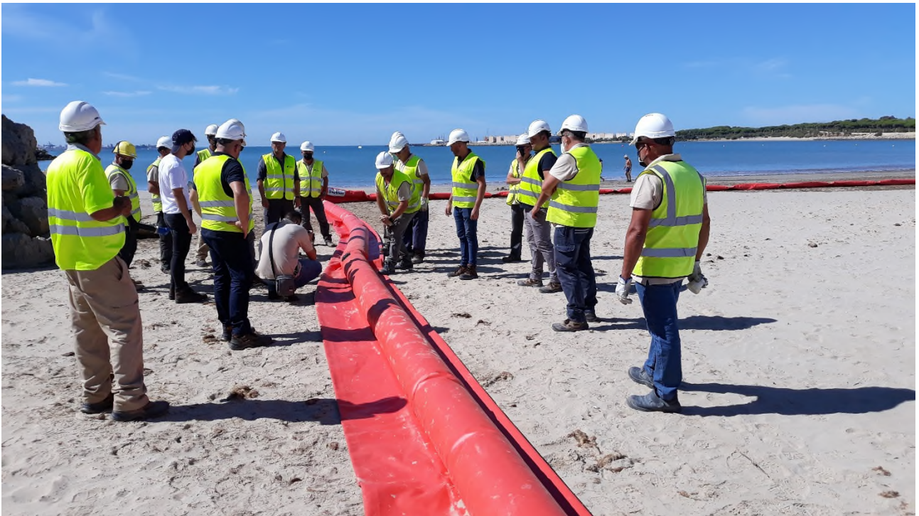
Ilustración 23. Barrera selladora una vez llena la cámara superior de aire.