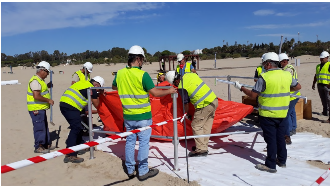
Ilustración 30. Montaje del Fast Tank en la zona de almacenamiento temporal de residuos.

Se procede al despliegue de un tanque Fast Tank y un tanque autoportante en la correspondiente zona delimitada en la actividad anterior (zona de acumulación de residuos).