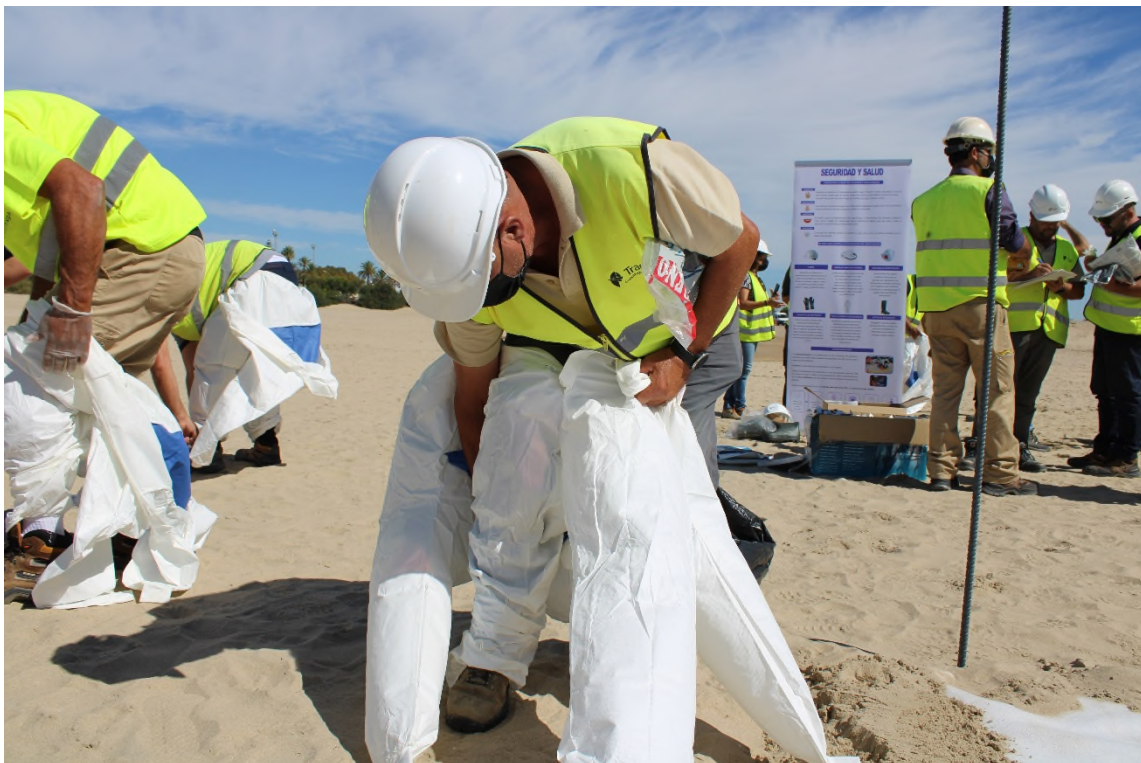
Ilustración 31. Personal interviniente equipándose los EPI en la zona habilitada para servicios.

No se utilizan ni botas ni gafas de protección para el ejercicio, aunque queda explicado que también son necesarias para la limpieza de la costa tras un vertido de hidrocarburos, así como el casco de seguridad.