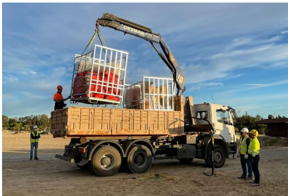
Ilustración 9. Camión volquete-grúa.