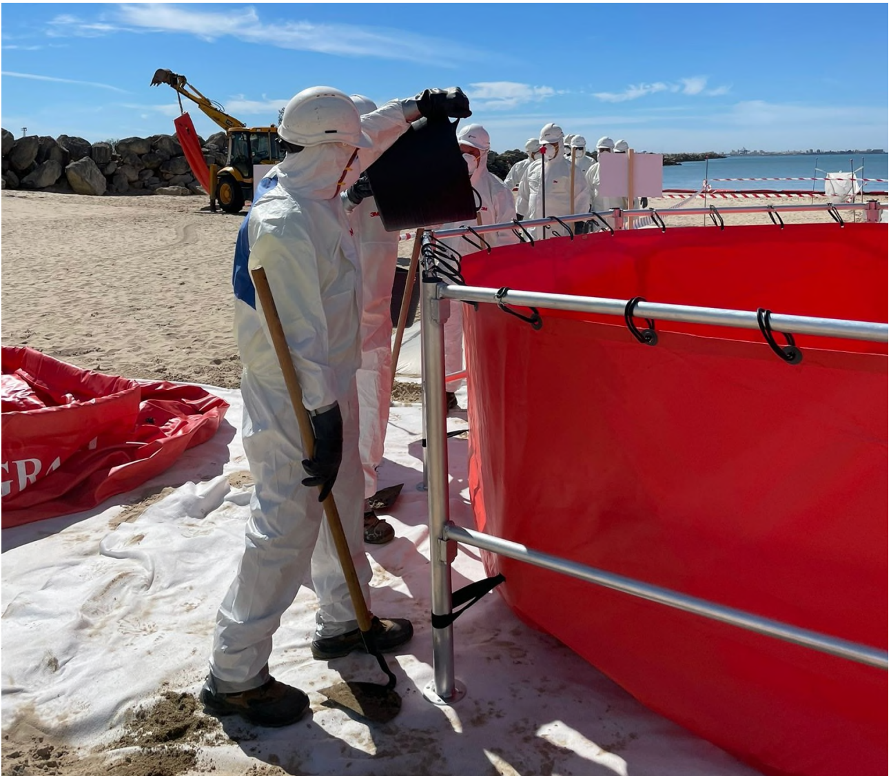
Ilustración 33. Personal desplazándose por los corredores para depositar el hidrocarburo recuperado.

Una vez finalizadas las labores de limpieza, el personal interviniente se ha desplazado a la zona de descontaminación para la retirada de los EPI contaminados y la recogida de las herramientas utilizadas. El acceso a esta zona se ha llevado a cabo por los corredores de descontaminación correspondientes. A la hora de quitarse los EPI se ha seguido la secuencia adecuada de descontaminación, que previamente se les había explicado en la parte teórica.