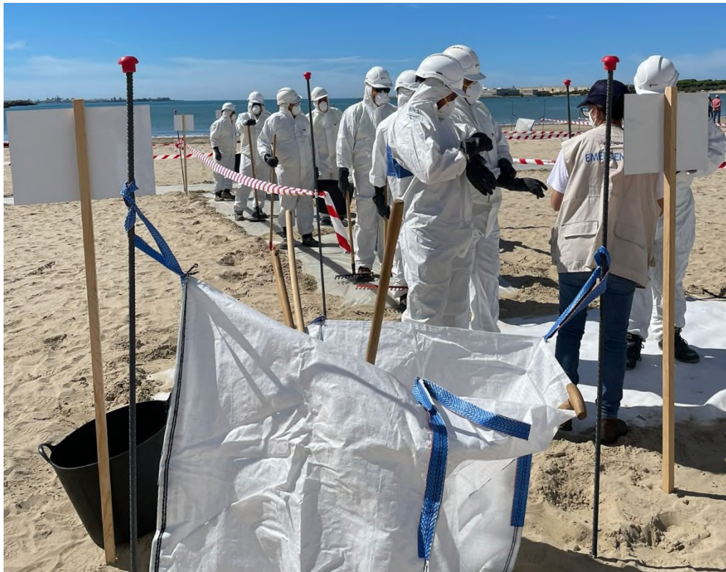
Ilustración 34. Retirada de EPI y recogida de herramientas en la zona de descontaminación.

Una vez finalizado el ejercicio de actuación en costa, se ha recogido todo el material desplegado en la zona y se ha transportado a la base de Jerez de la Frontera, donde se ha llevado a cabo su limpieza y almacenamiento.