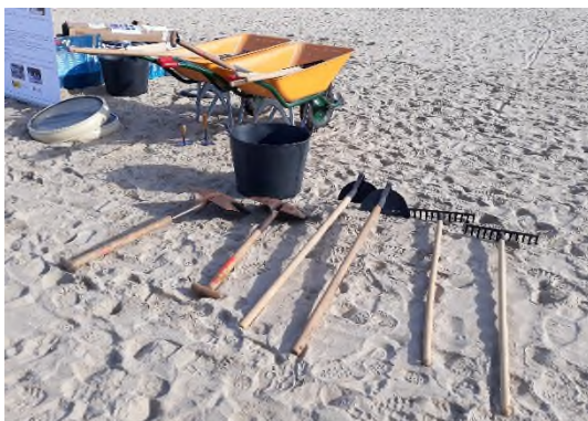
Ilustración 5. Herramientas para la limpieza en la playa.