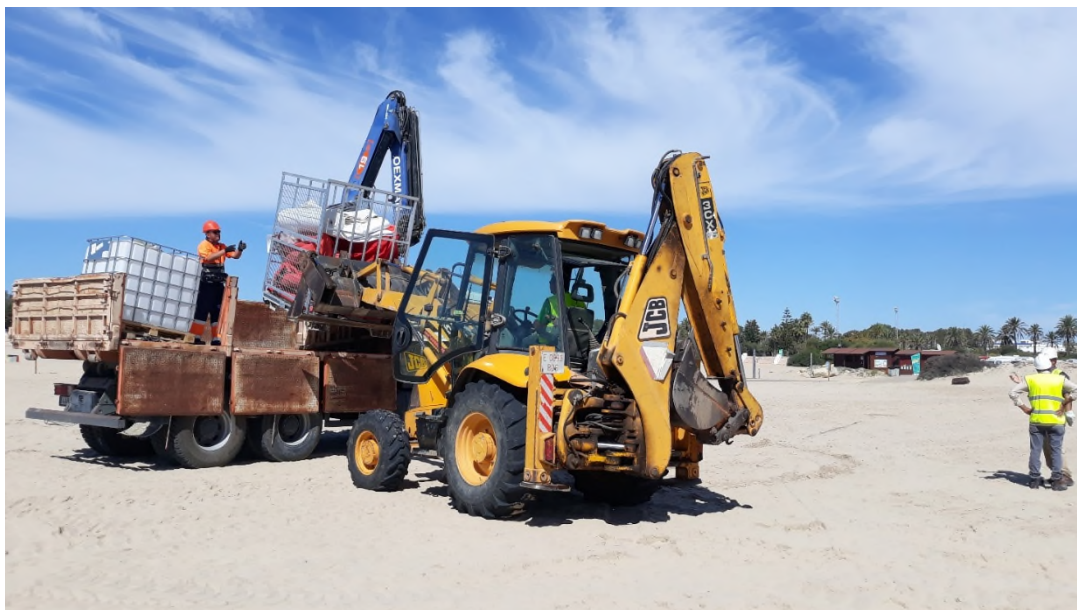
Ilustración 35. Recogida de los equipos utilizados una vez finalizada la jornada.

Una vez finalizado el ejercicio de actuación en costa, se ha recogido todo el material desplegado en la zona y se ha transportado a la base de Jerez de la Frontera, donde se ha llevado a cabo su limpieza y almacenamiento.