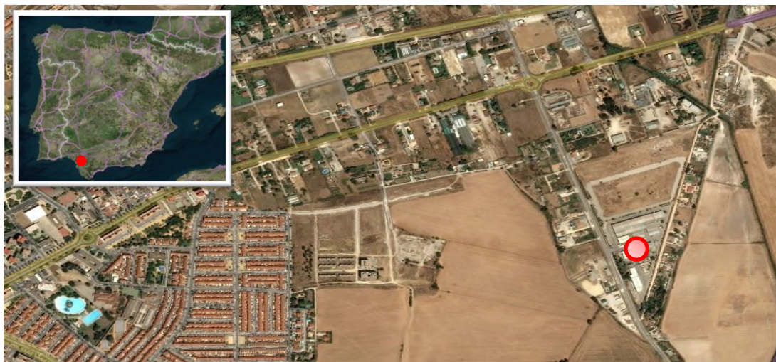
Ilustración 2. Localización de la base logística de Jerez de la Frontera.

El día 5 de octubre de 2021 se visita la base logística de Jerez de la Frontera, localizada en Carretera de Arcos Km 1.5. Local 25. Polígono Industrial Navestrella, 11407 Jerez de la Frontera, Cádiz.