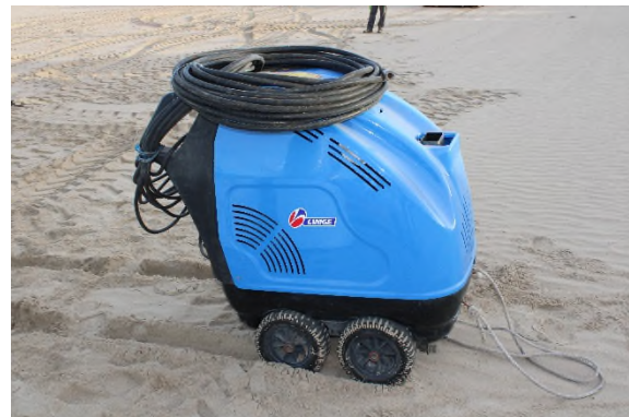
Ilustración 10. Hidrolimpiadora