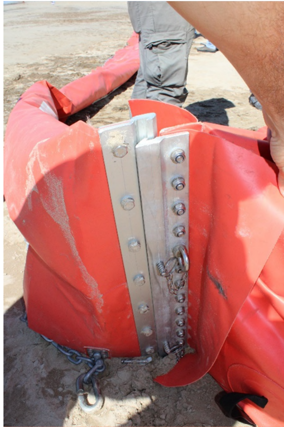
Ilustración 25. Empatado de barrera cilíndrica con barrera selladora

Al finalizar la jornada, se vacían las cámaras de aire y de agua de la barrera selladora y se recogen dichos equipos de contención colocándolos en los respectivos jaulones.