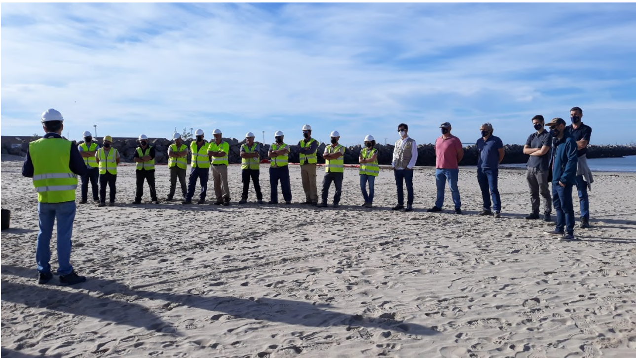
Ilustración 15. Charla formativa por parte del técnico responsable de PRL.

Se ha contado con un técnico responsable de PRL (Prevención de Riesgos Laborales) durante el ejercicio, quien se ha encargado de realizar esta parte formativa.