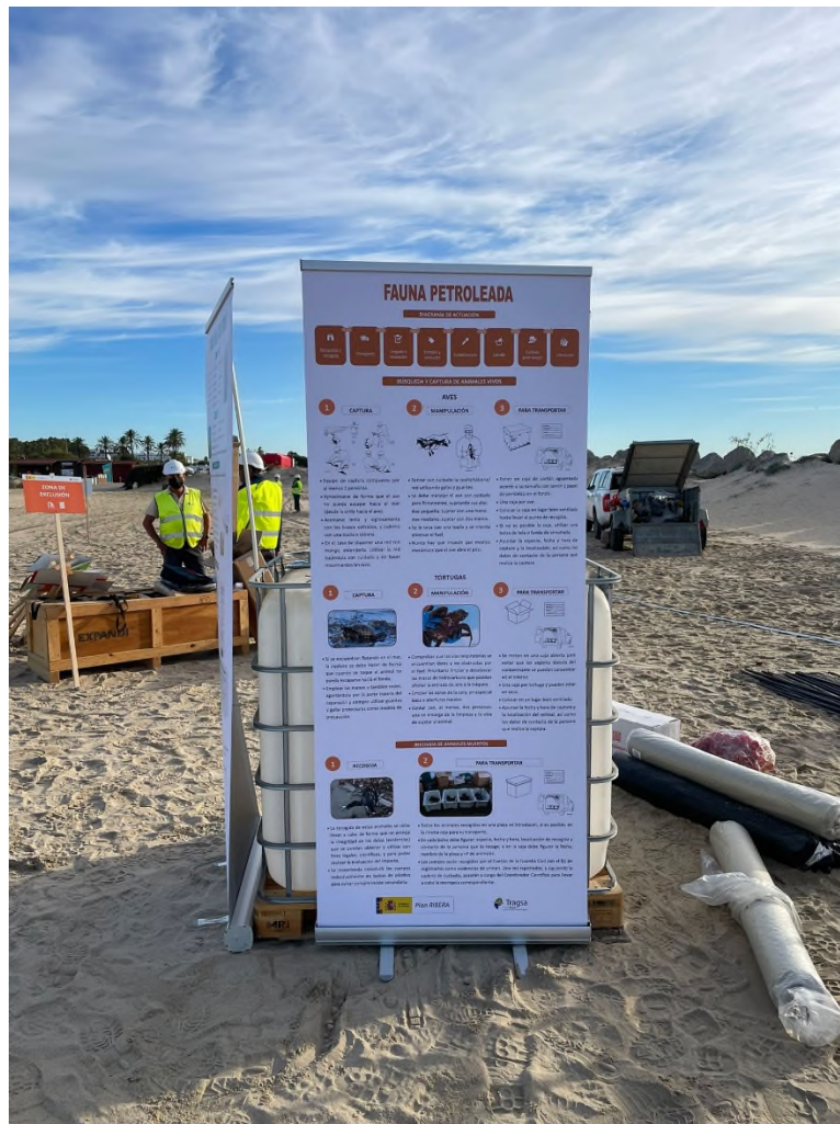
Ilustración 21. Roll-up charla formativa de la fauna petrolada.

El material didáctico utilizado durante la formación teórica se encuentra en el Anexo II.