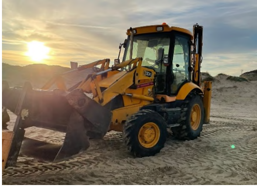
Ilustración 7. Retrocargadora mixta.