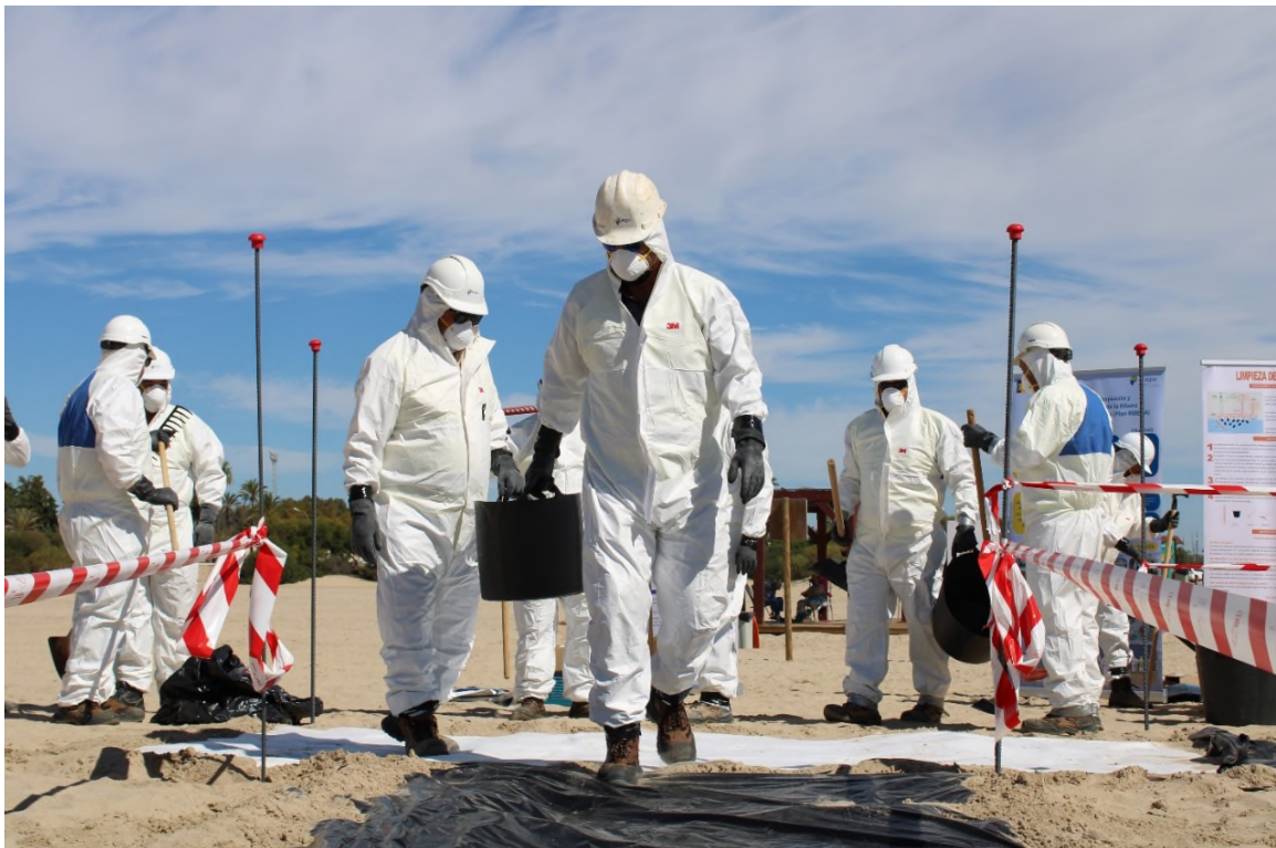
Ilustración 28. Recogida de las herramientas de limpieza al comienzo del corredor limpio.

Por último, se ha dispuesto una zona de servicios con un área de colocación de EPI a la entrada del corredor limpio y el propio corredor limpio que comunica con la zona de actuación, donde el personal recoge parte de las herramientas de limpieza.