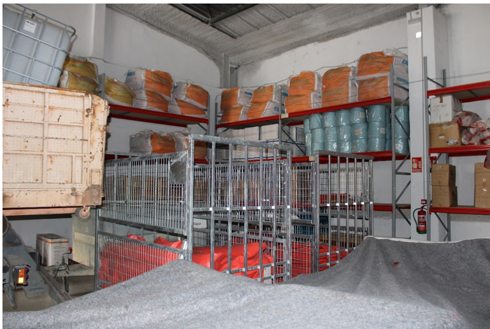
Ilustración 11. Distribución material de LCC en estanterías y jaulones de almacenamiento.

Los medios y equipos del Plan RIBERA están distribuidos en un único almacén. El almacenamiento se realiza principalmente por medio de estanterías industriales. Los equipos y materiales de LCC se almacenan en cajas de cartón o madera, pallets o en contenedores "big box". Asimismo, se cuenta con jaulones metálicos de almacenamiento donde se encuentran almacenadas parte de las barreras de contención que hay en la base.