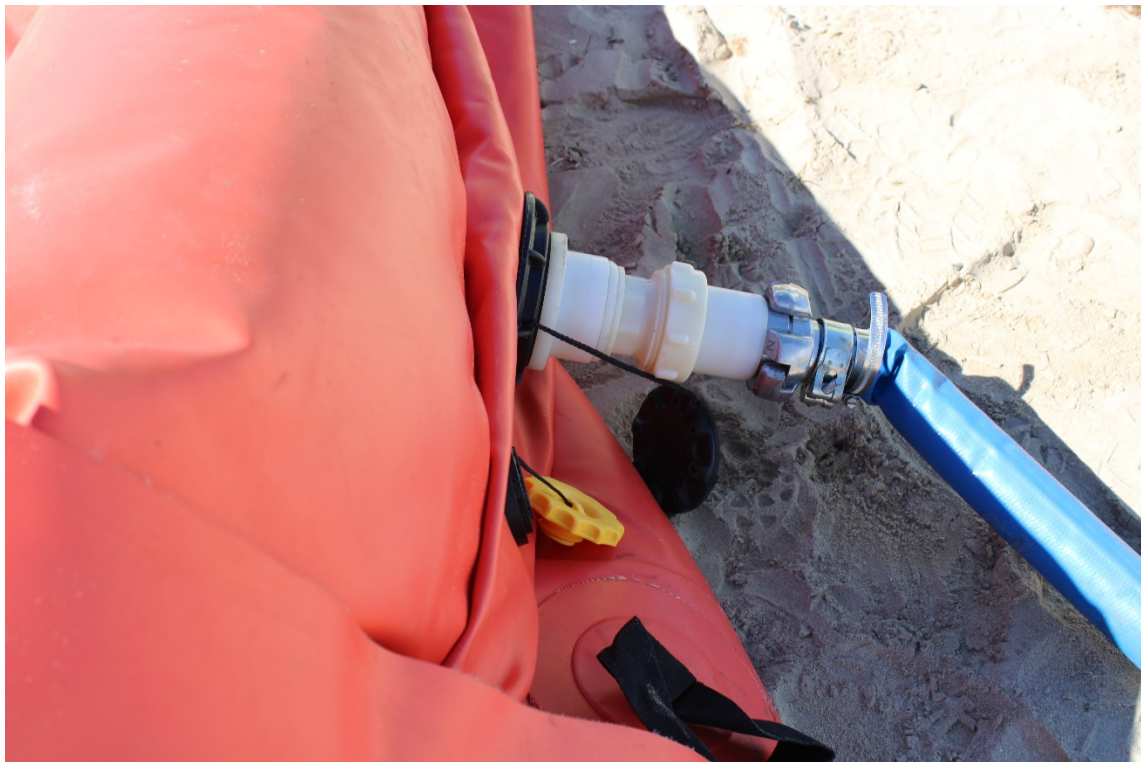
Ilustración 24. Llenado de agua de las cámaras inferiores de la barrera selladora.