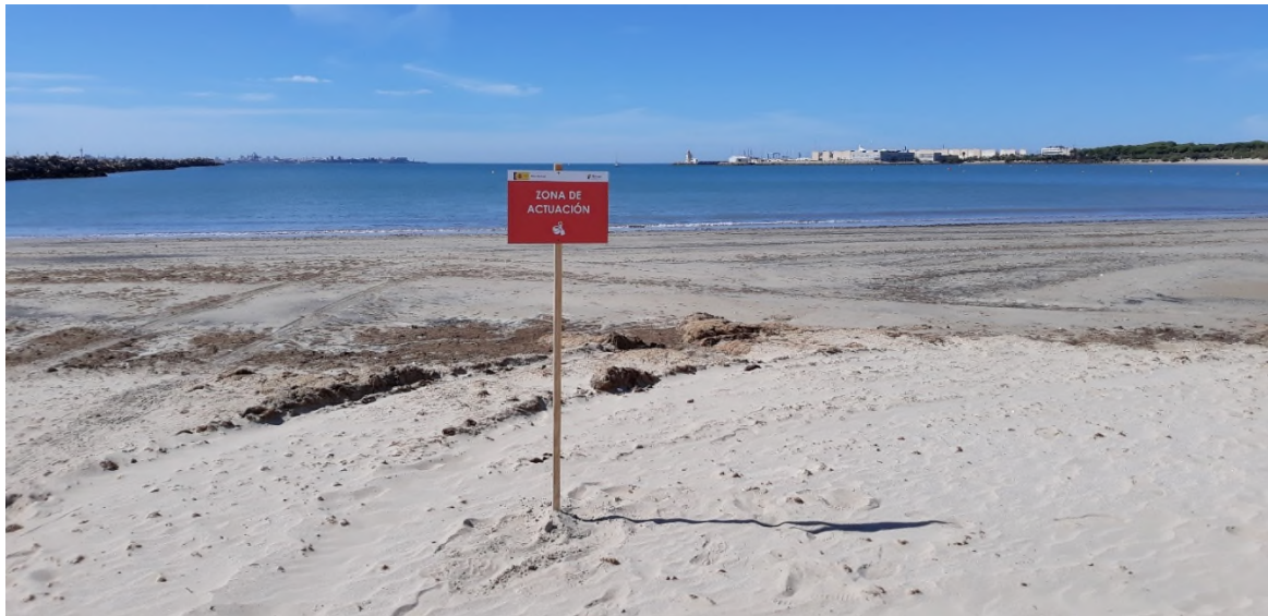
Ilustración 27. Vista de la zona de actuación (con su cartel)

Por último, se ha dispuesto una zona de servicios con un área de colocación de EPI a la entrada del corredor limpio y el propio corredor limpio que comunica con la zona de actuación, donde el personal recoge parte de las herramientas de limpieza.