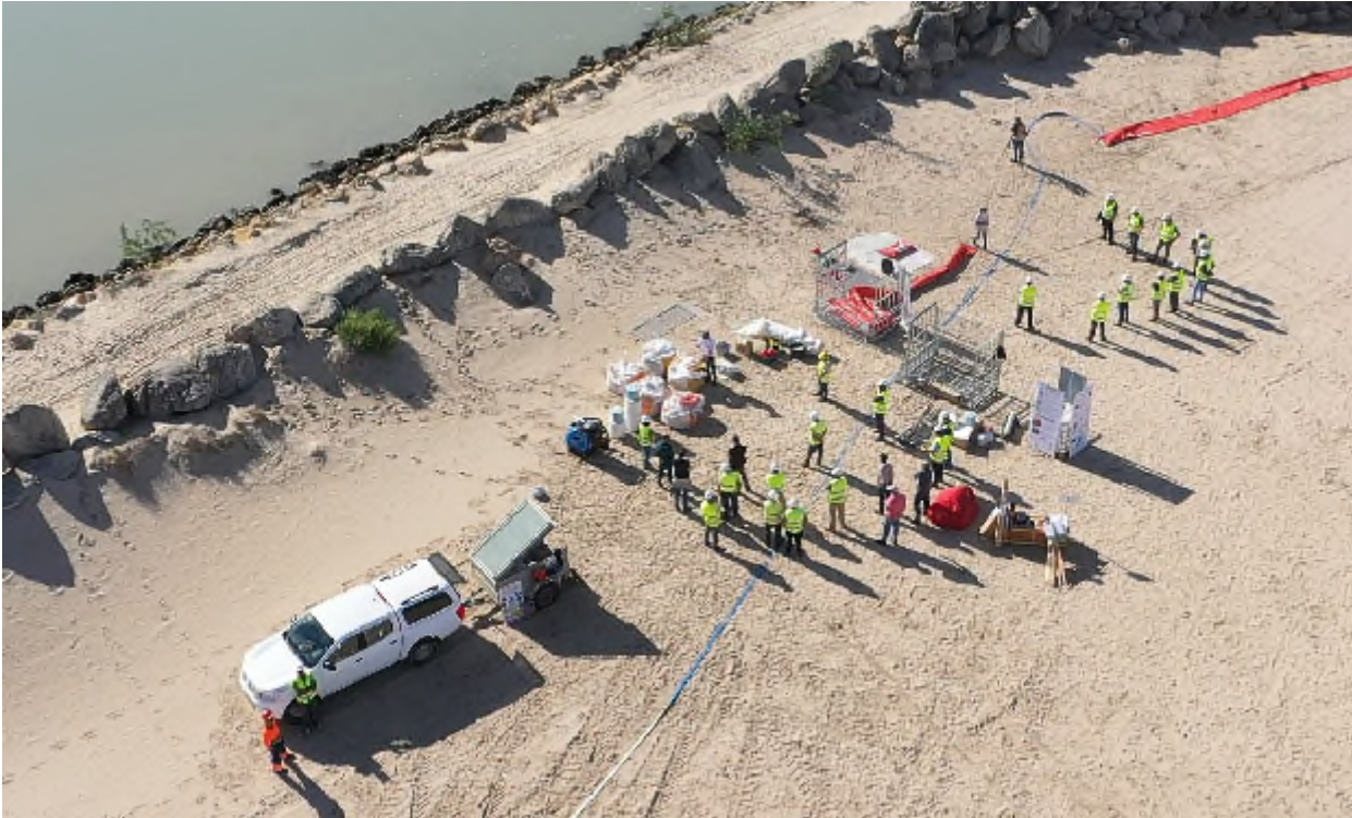
Ilustración 17. Momento de la formación sobre materiales absorbentes (a la izquierda).