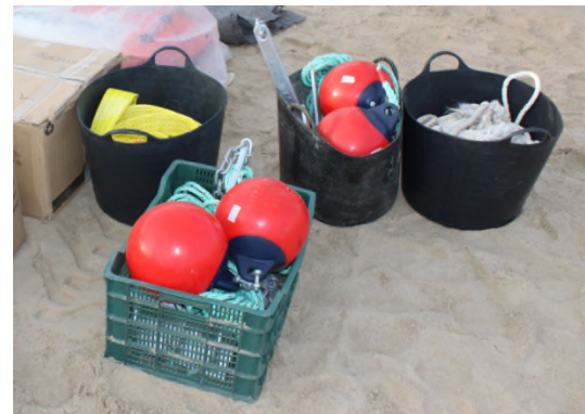
Ilustración 4. Equipos de fondeo y cabos.