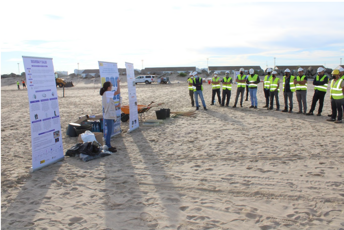
Ilustración 14. Exposición inicial introductoria al Plan RIBERA y a la jornada de formación.

Por último, se indican los medios materiales procedentes de la base de Jerez que se van a utilizar en la parte práctica, que se explican con más detalle en el resto de la formación teórica que se recibe a continuación.