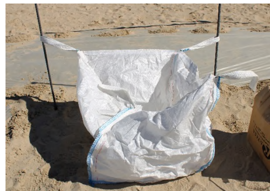
Ilustración 6. Sacas big-bag