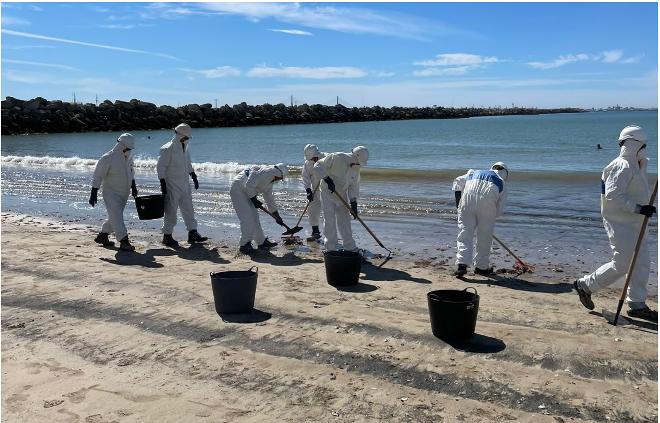
Ilustración 32. Simulación de labores de limpieza en la costa.

Finalmente, el personal debidamente equipado con los EPI, ha procedido a la simulación de las labores de recogida y limpieza de la playa, utilizando para ellos las herramientas de limpieza (palas, rastrillos, tamices, etc...) y desplazándose por los corredores establecidos con el fin de evitar la contaminación secundaria.