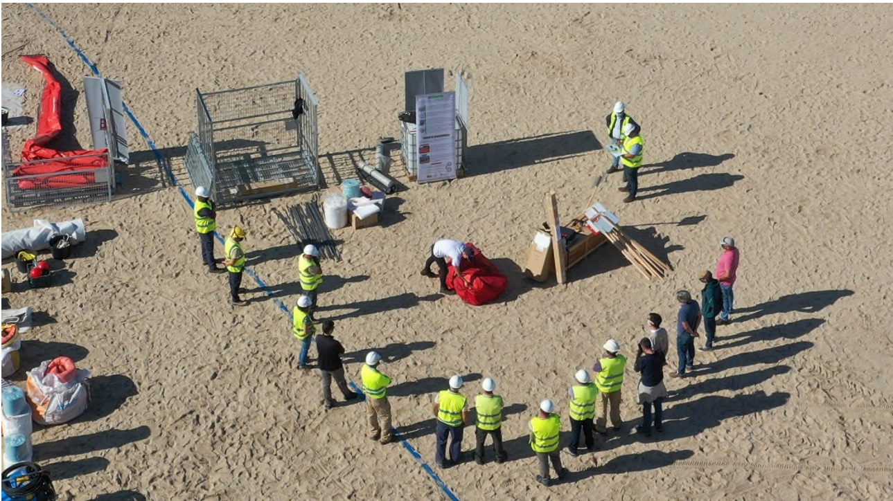
Ilustración 18. Muestra de un tanque autoportante en la charla formativa sobre tanques de almacenamiento.