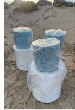
Ilustración 8. Rollos y barreras absorbentes