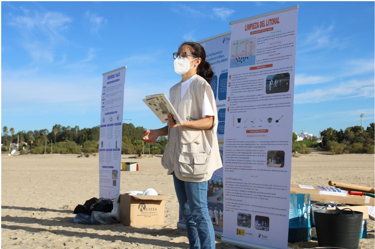
Ilustración 19. Charla formativa sobre la limpieza de la costa contaminada.

Por último, se ha informado de cómo tras recoger el hidrocarburo, debe ser transportado hasta los depósitos intermedios de almacenamiento (big-bag) a través de corredores establecidos a tal efecto o hasta la zona establecida para almacenamiento temporal de residuos en la zona de exclusión. Se ha destacado la importancia de recoger la menor cantidad de arena, piedras, etc. posible durante estas labores para minimizar la cantidad de residuo peligroso generado.