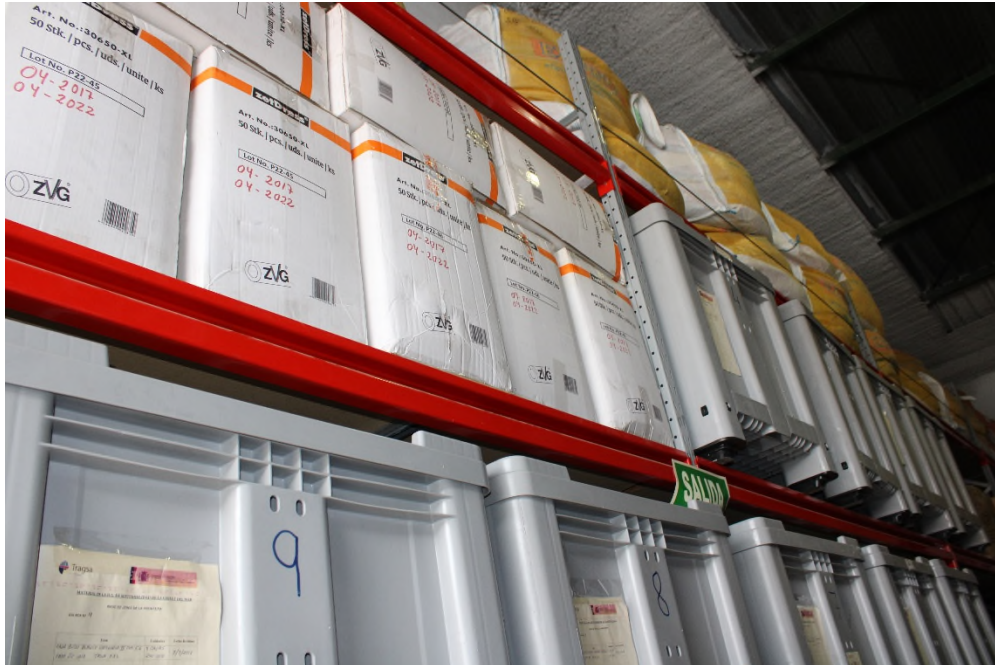
Ilustración 12. Distribución de material de LCC en cajas “Big-box” numeradas y cajas de cartón.

Todo ello con el objeto de lograr la mejor eficacia, tanto en localización, rapidez de movimientos de equipos, economía de utilización de espacios, control de inventarios, etc.