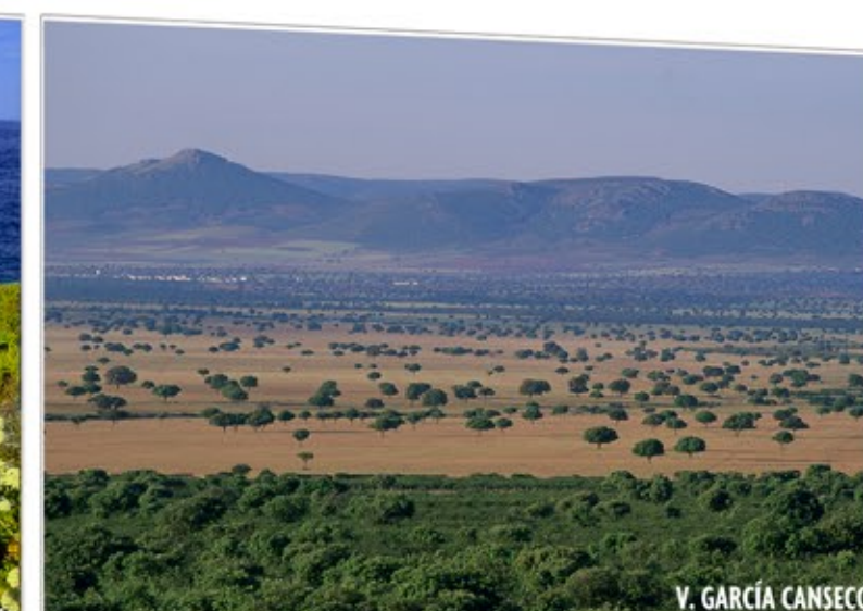
Horizontes infinitos CABAÑEROS