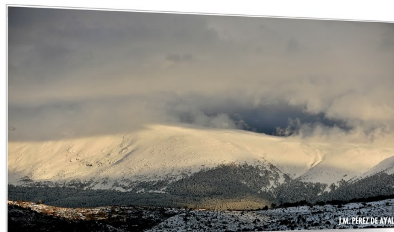
Las cumbres dormidas SIERRA DE GUADARRAMA