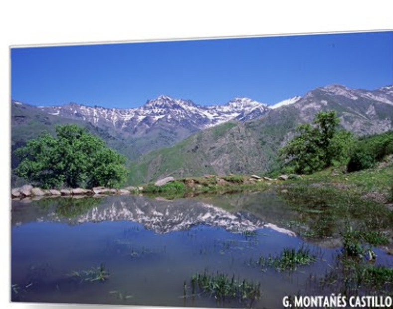
Vida en las cumbres SIERRA NEVADA

For further information: http://www.magrama.gob.es/es/red-parques-nacionales/