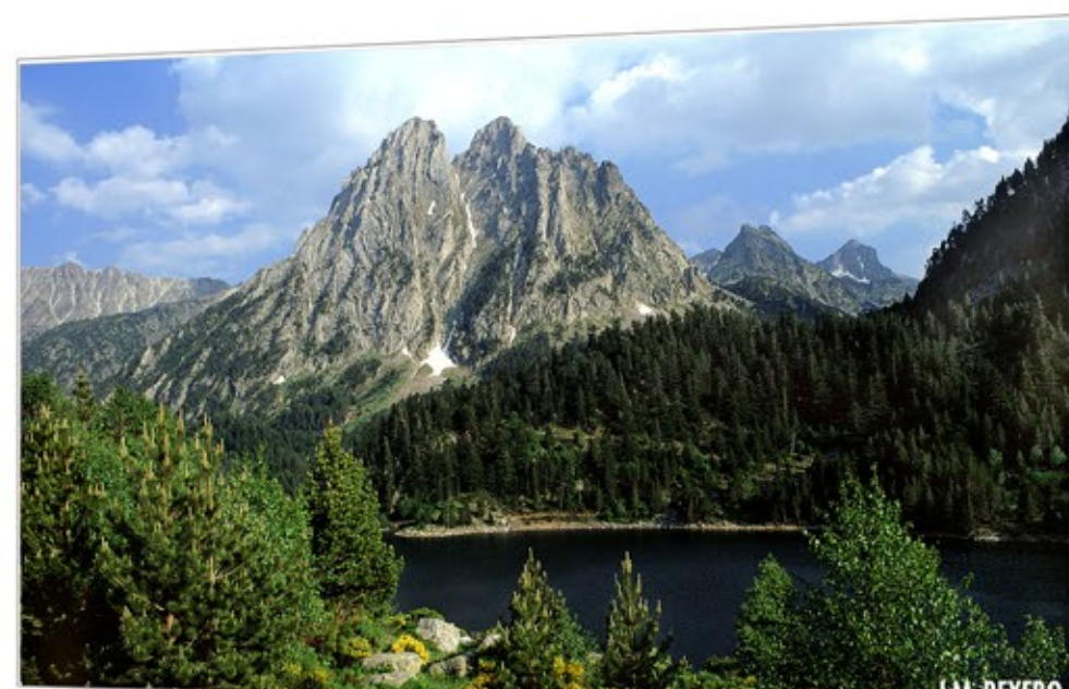
Tierra de Lagos AIGÜESTORTES I ESTANY DE SANT MAURICI