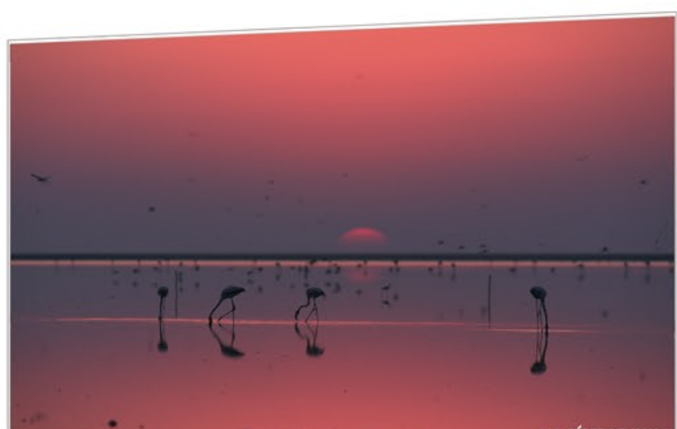
Mosaico vivo DOÑANA