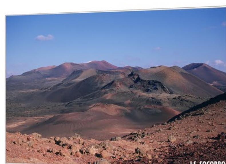
Detenido en el tiempo TIMANFAYA