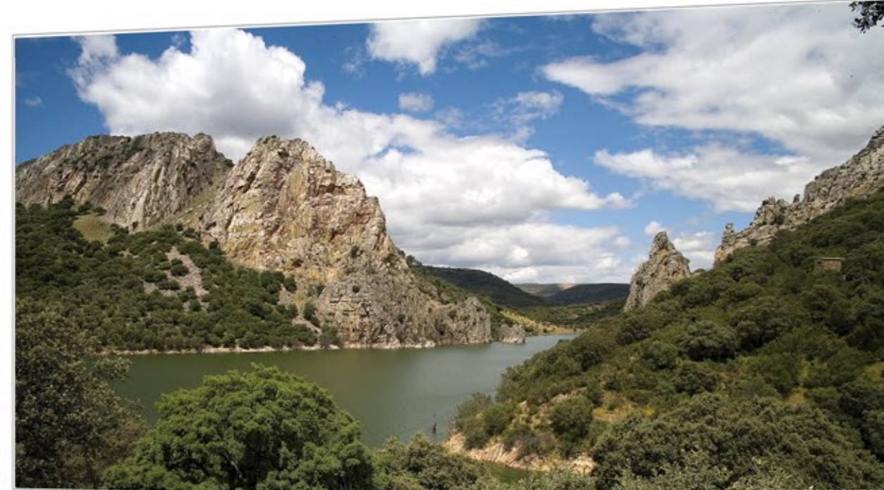
Un mundo alado MONFRAGÜE