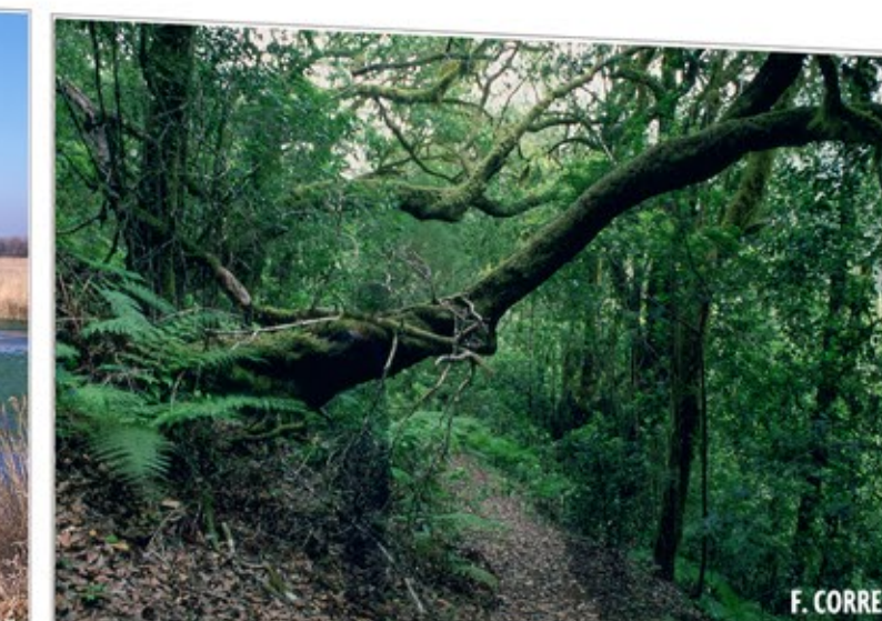
Recuerdos mágicos GARAJONAY

http://www.magrama.gob.es/es/red-parques-nacionales/