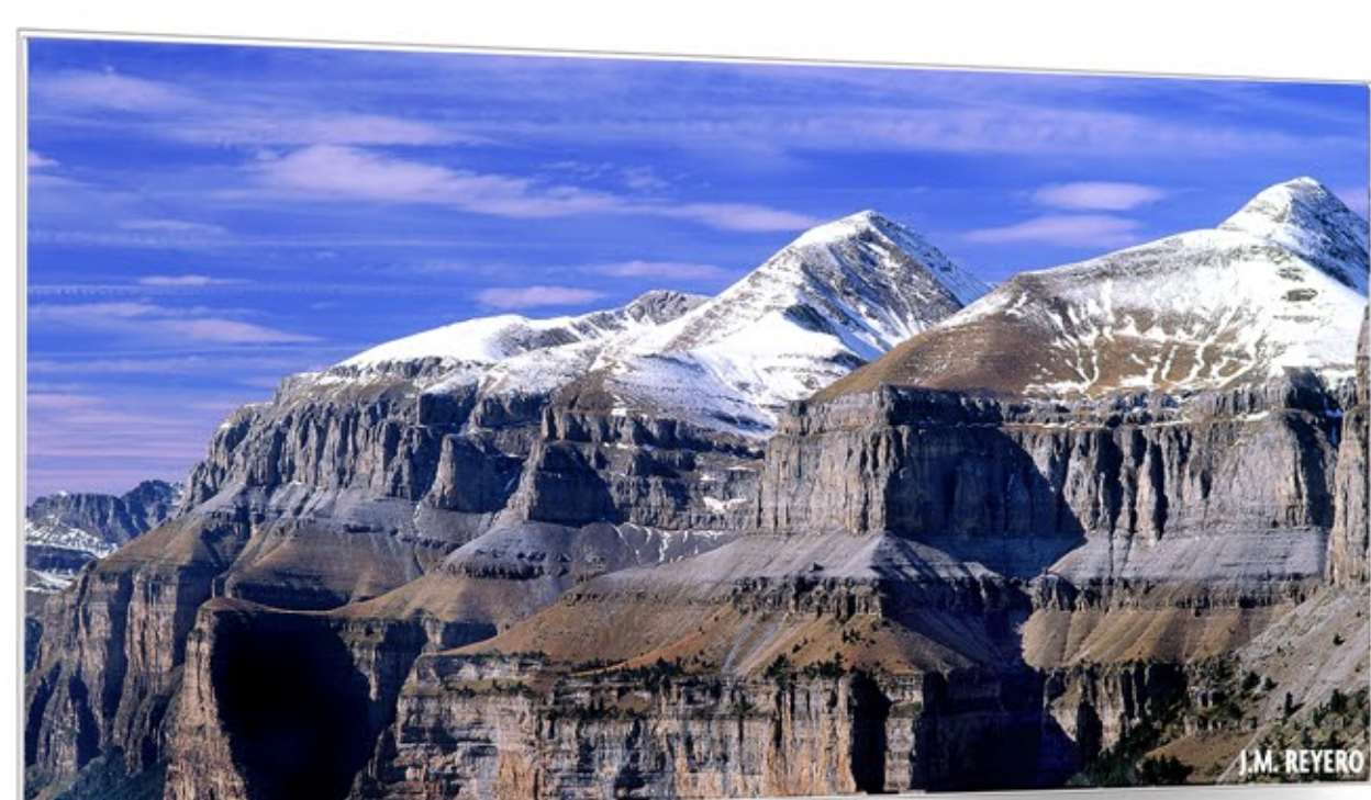
Balcones al Cielo ORDESA Y MONTE PERDIDO