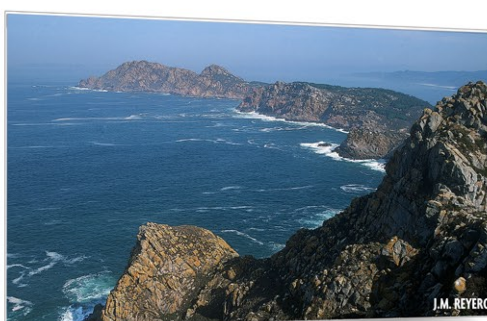
Vigías del Atlántico ISLAS ATLÁNTICAS DE GALICIA