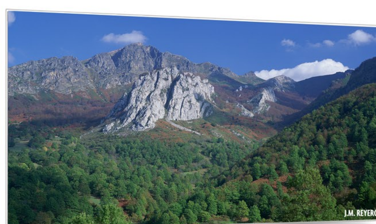
Naturaleza y gentes PICOS DE EUROPA