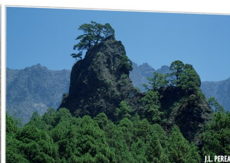
Riscos Imposibles CALDERA DE TABURIENTE