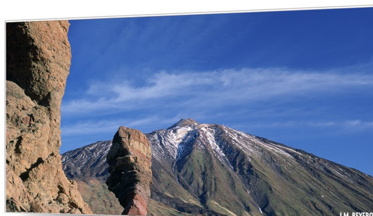
A la sombra del volcán TEIDE