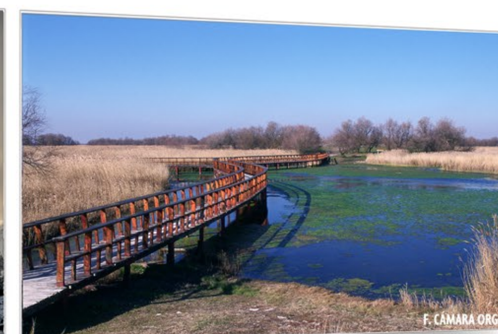
El milagro del agua LAS TABLAS DE DAIMIEL