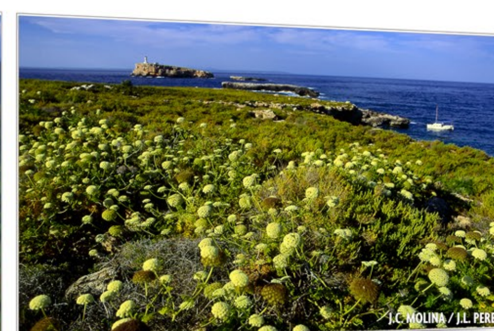
Transparencia marina ARCHIPIÉLAGO DE CABRERA