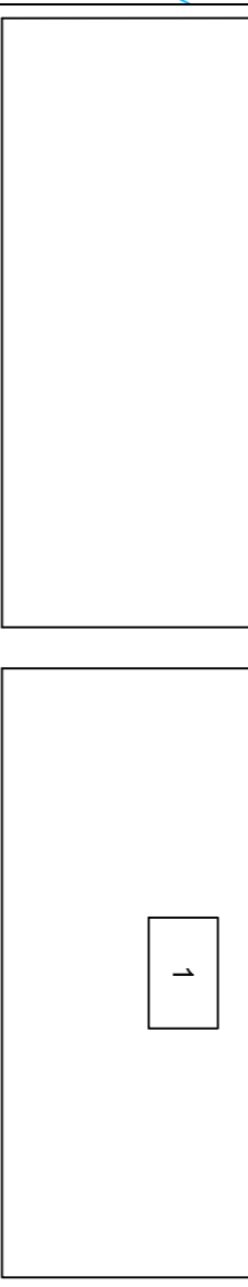
GRAFICO DE DISTRIBUCION DE HOJAS

INFORMACION CARTOGRAFICA PROTECCION Y COORDENADAS U.T.M. -NAD83