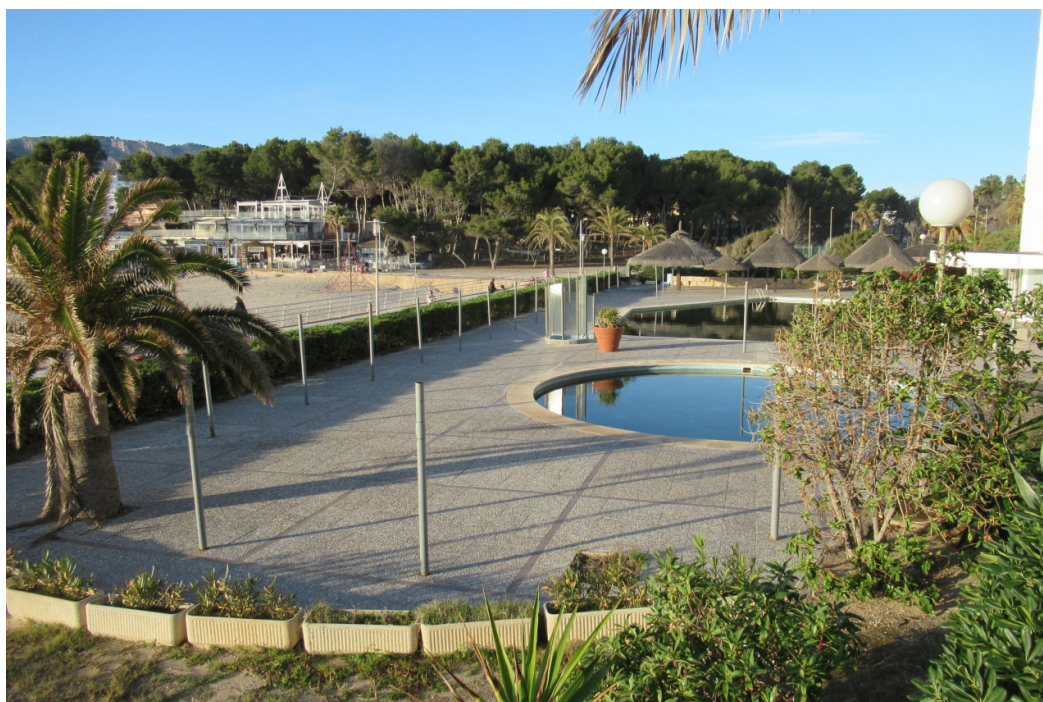
Vista general de terrazas

Esta zona se considera de transito público y gratuito, independientemente que existe tránsito peatonal por la parte del paseo marítimo, sobre esta zona se instalaran hamacas y sombrillas consideradas como instalaciones desmontables de temporada.