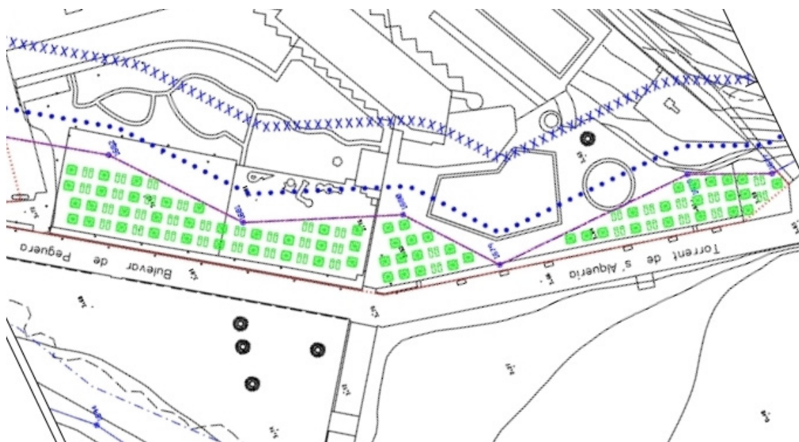
Distribución de sombrillas y hamacas, instalaciones desmontables de temporada

Las instalaciones desmontables complementa el servicio de temporada de playa las cuales se instalaran sobre la superficie denominadas plataforma y terraza en dominio público a solicitar concesión, y en plano 5 de Documento 2, se acompaña plano de distribución de instalaciones, las cuales se hacen referencia para ser incluidas dentro de la solicitud de concesión.