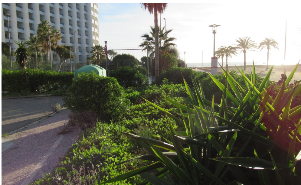
Vista de jardines

4. Jardines, existen 2 tramos de jardines continuos, zonas existentes una ubicada sobre la terraza a cota +3,62 con una superficie de 180,75 m 2 , y otra al norte sobre cota +3,00 con una superficie de 340,92 m 2 , y una superficie total de 521,67 m 2