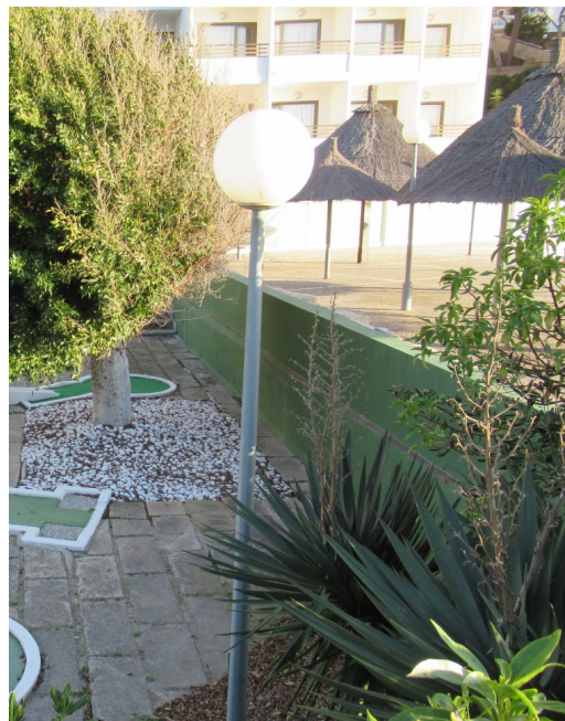
Vista general de muros

4. Jardines, existen 2 tramos de jardines continuos, zonas existentes una ubicada sobre la terraza a cota +3,62 con una superficie de 180,75 m 2 , y otra al norte sobre cota +3,00 con una superficie de 340,92 m 2 , y una superficie total de 521,67 m 2