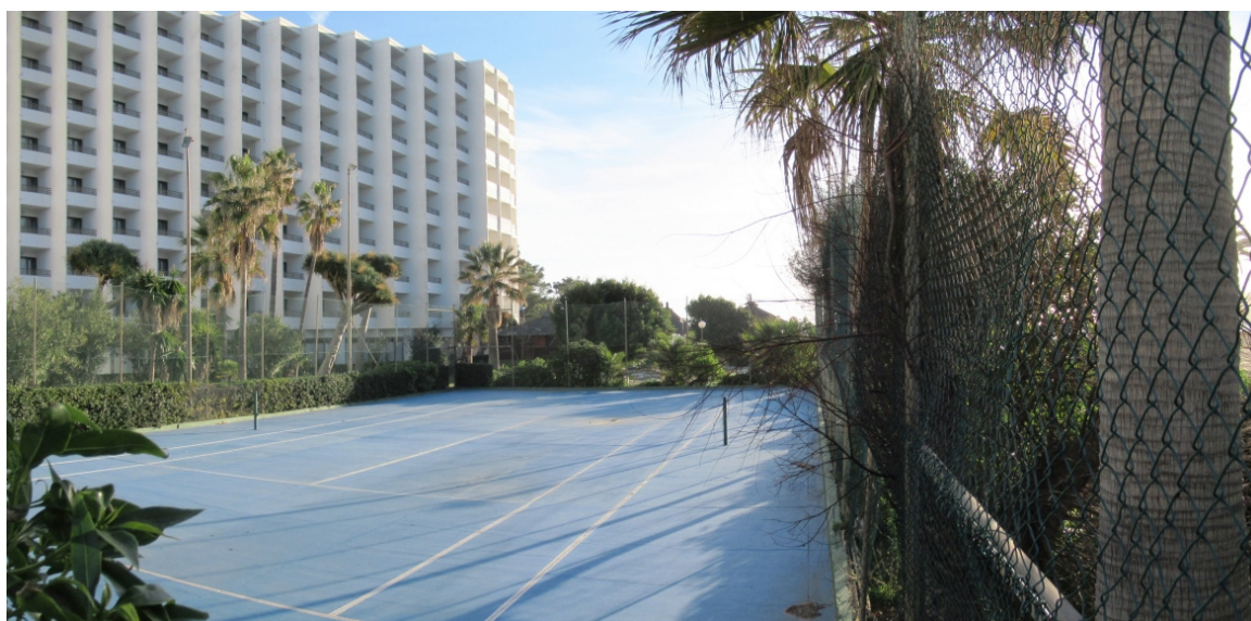
Vista general plataforma zona norte

Las plataformas tienen una superficie de ocupación total en dominio público de 493,85 m 2 , su estado de conservación es bueno.