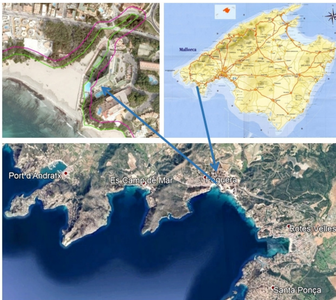
Situación de instalaciones que se solicita concesión, Tramo Playa de Tora, Urb. La Romana-Peguera, T.M. Calvià

En Documento nº 2 Planos, se adjunta plano que define la ubicación, situación y detalle de las instalaciones a solicitar concesión